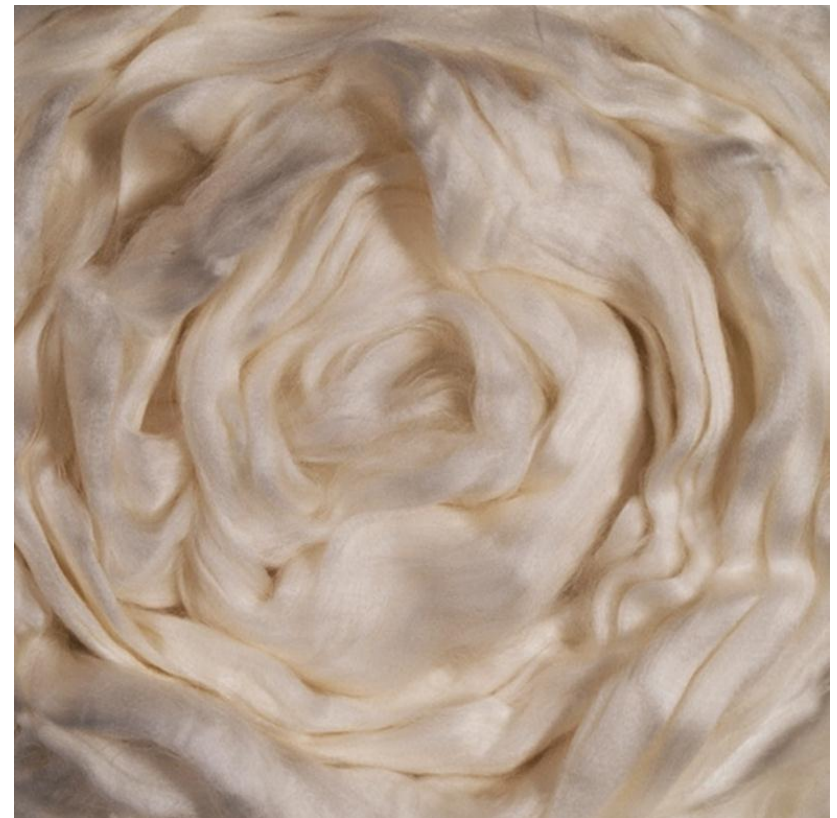
Ацетатне волокно для сигаретного фільтру