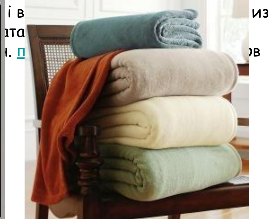
Рушники з мікрофібри