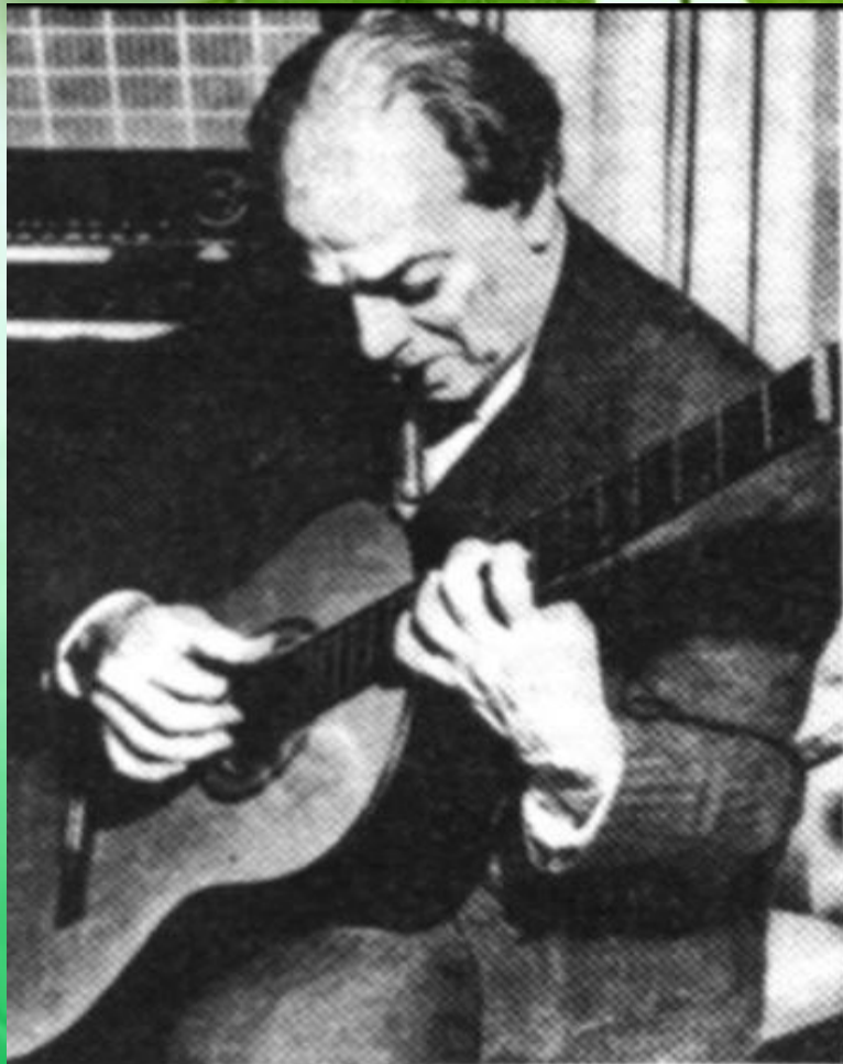
HEITOR VILLA LOBOS

Родился в городе Рио-де-Жанейро, – выдающийся бразильский композитор, знаток музыкального фольклора, дирижер, педагог.