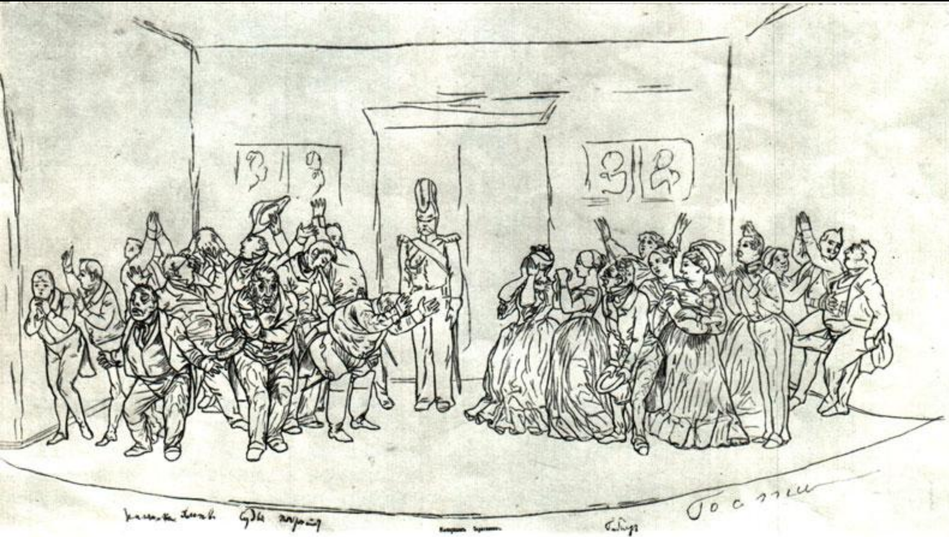
«РЕВИЗОР». ЗАКЛЮЧИТЕЛЬНАЯ СЦЕНА. Рисунок Н. В. Гоголя (?)