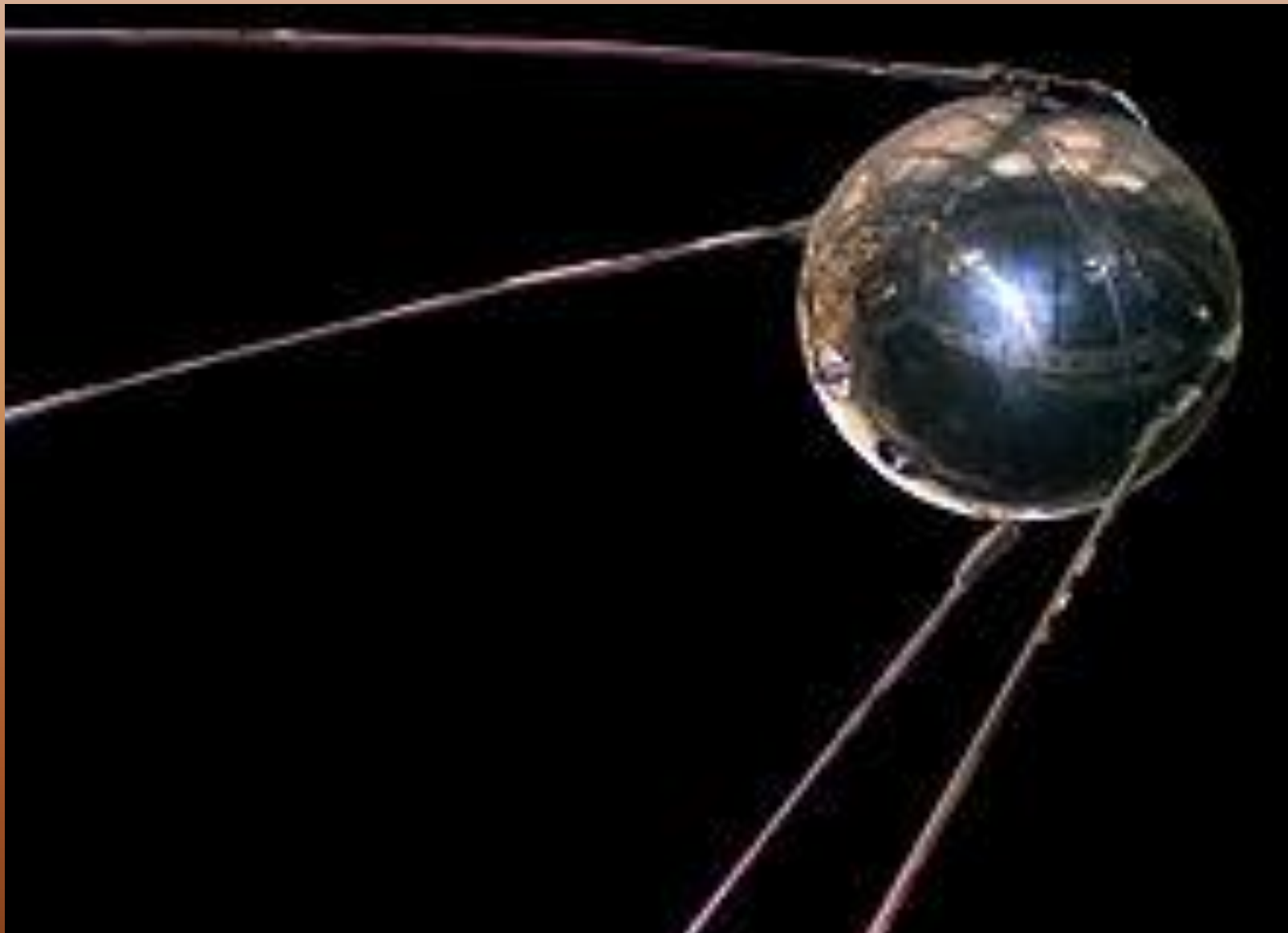
Перший штучний супутник Землі.