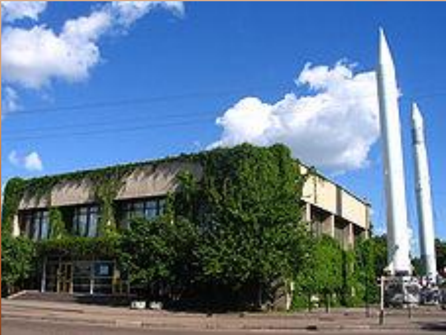
Музей космонавтики ім. С. Корольова