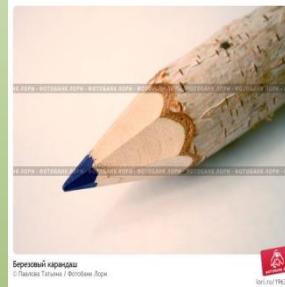
Березовый карандаш