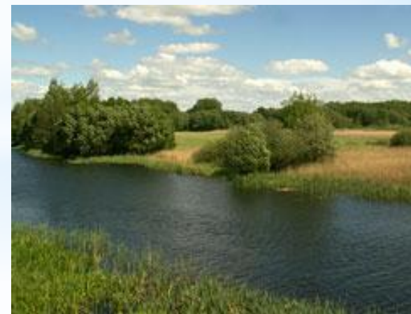
Участок Пойма Псла