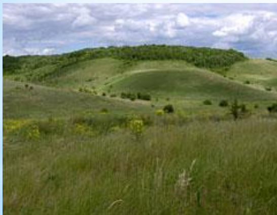
Участок Букреевы Бармы