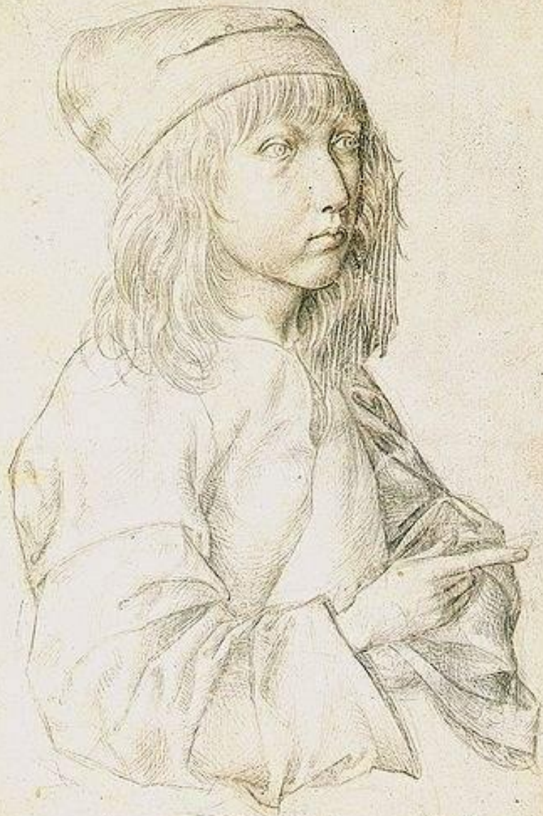
Автопортрет. Рисунок серебряным карандашом

Das hat der meiste ein pappell nach wie solches künstlich ist 1487 in der 18. nach ein künstler in huffe d'ere