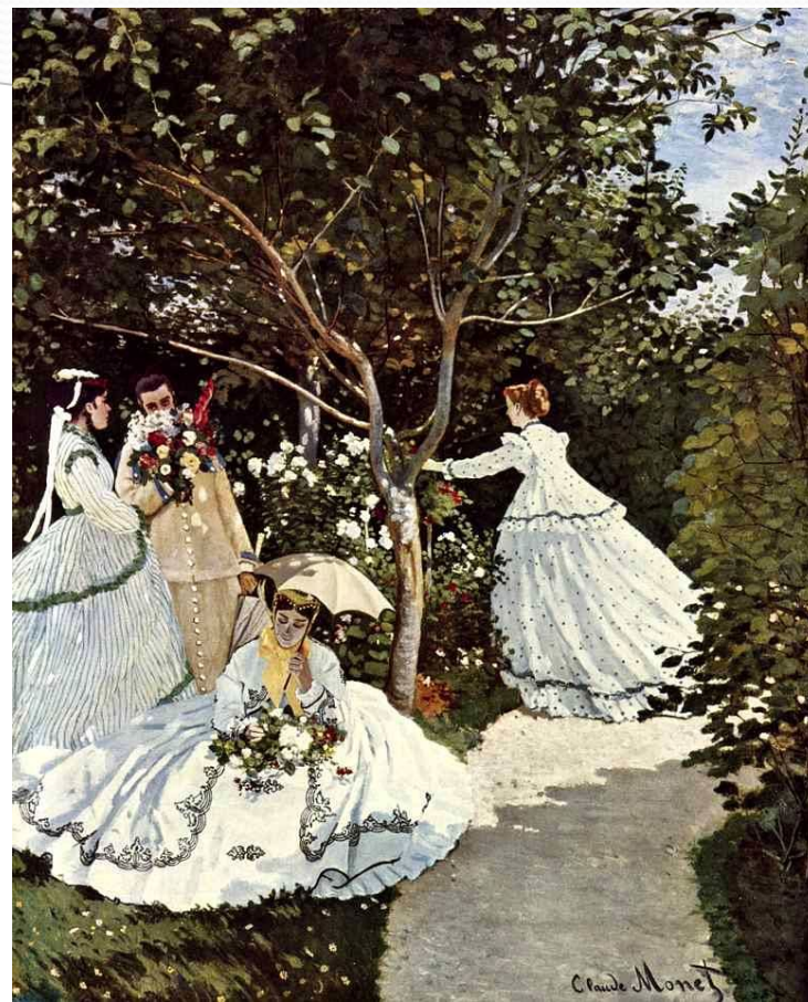
Женщины в саду Год создания 1867