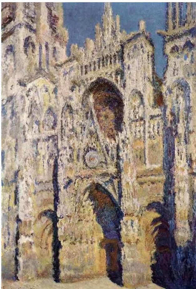
Собор в Руане. Год создания 1894