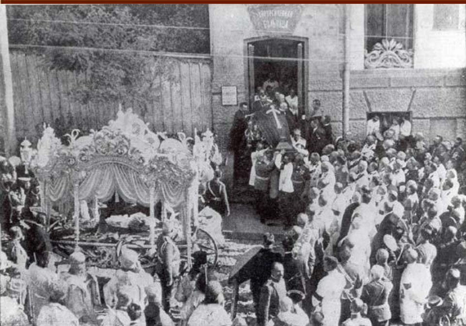
Выносъ тѣла П. А. Столыпина изъ больницы бр. Маковскихъ.