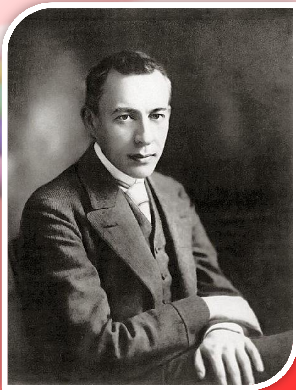
Сергей Васильевич Рахманинов