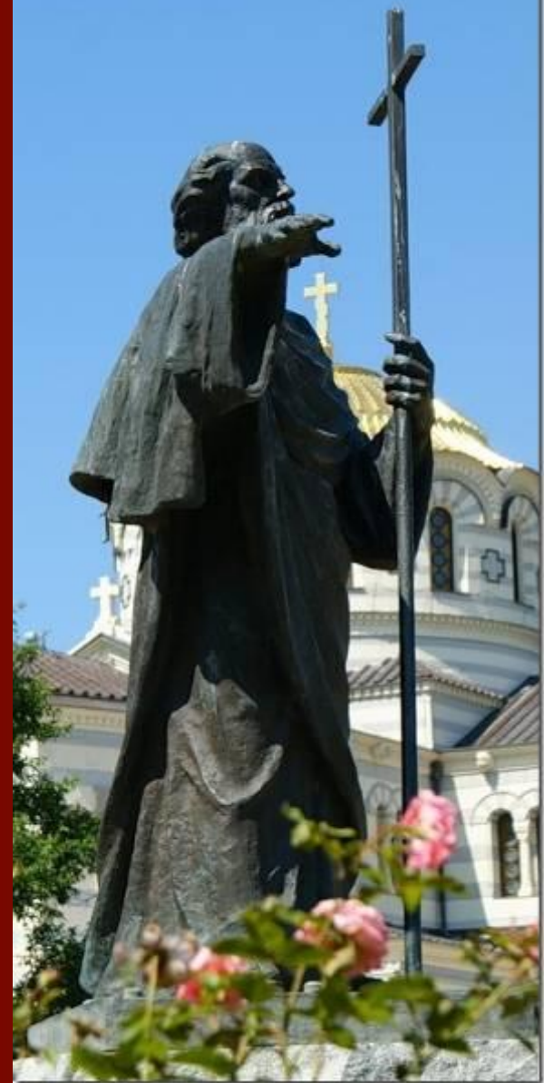
Памятник Владимиру Рядом с Храмом в Херсонесе.