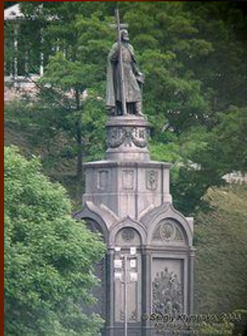
Памятник Владимиру В Киеве.