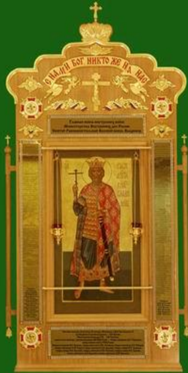
ПО БЛАГОСЛОВЕНИЮ СЯТЕЙШЕГО ПАТРИАРХА МОСКОВСКОГО И ВСЕЯ РУСИ АЛЕКСИЯ II ИЗГОТОВЛЕНА И ОСВЯЩЕНА ГЛАВНАЯ ИКОНА ВНУТРЕННИХ ВОЙСК МВД РОССИИ "СВЯТОЙ РАВНОАПОСТОЛЬНЫЙ ВЕЛИКИЙ КНЯЗЬ ВЛАДИМИР"