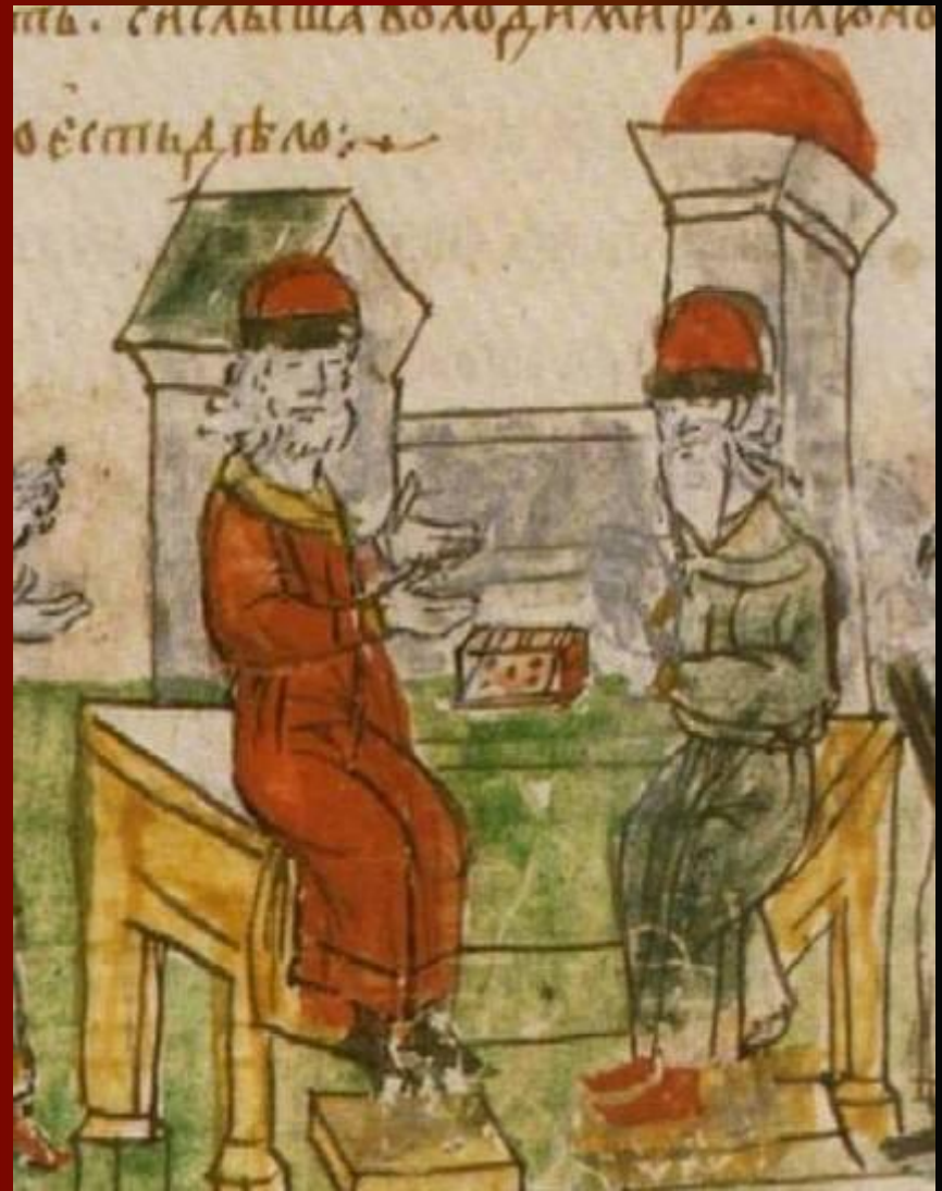
Беседа с греческим философом