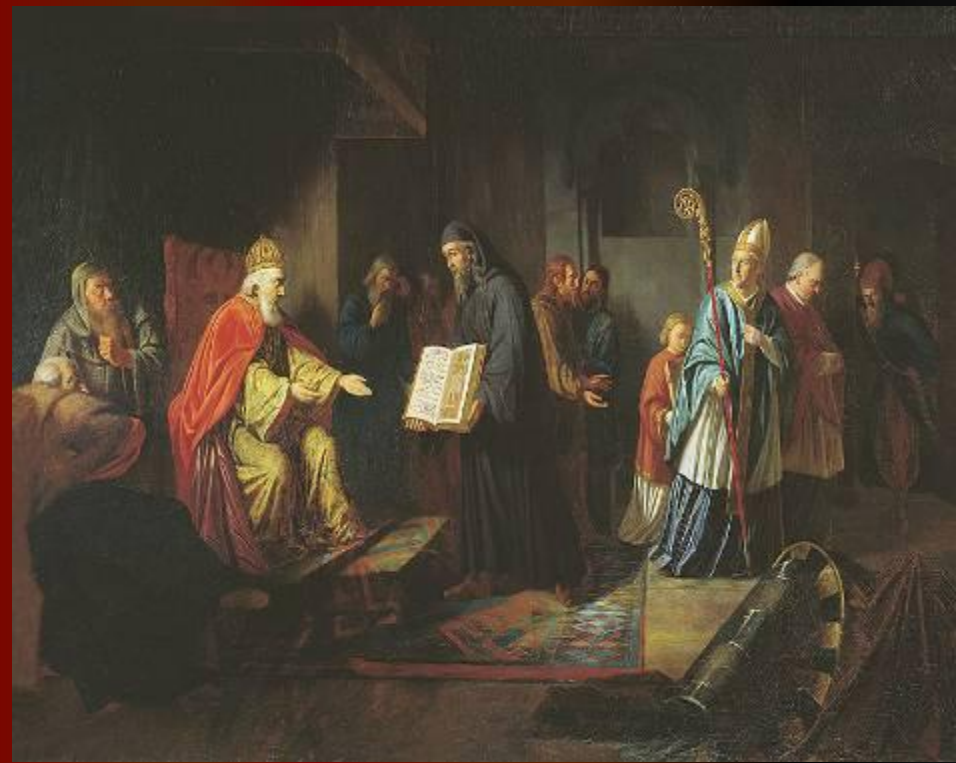
Выбор веры князем Владимиром

"Повесть временных лет" рассказывает, что в 986 г. в Киеве появились представители всех трёх перечисленных стран, предлагая Владимиру принять их веру. Ислам был отвергнут князем, поскольку ему показалось чересчур обременительным воздержание от вина, иудаизм - из-за того, что исповедовавшие его евреи лишились своего государства и были рассеяны по всей земле. Отверг князь и предложение перейти в веру, сделанное посланцами папы римского. Проповедь же представителя византийской церкви произвела на князя самое благоприятное впечатление.