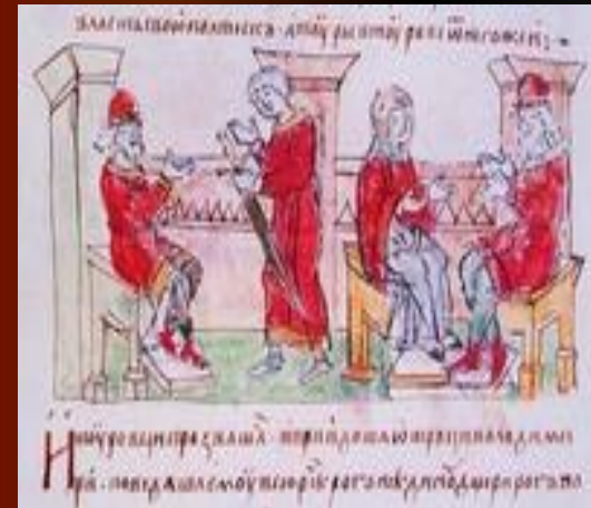
Сватовство Владимира к Рогнеде ( миниатюра из Радзивилловской летописи)