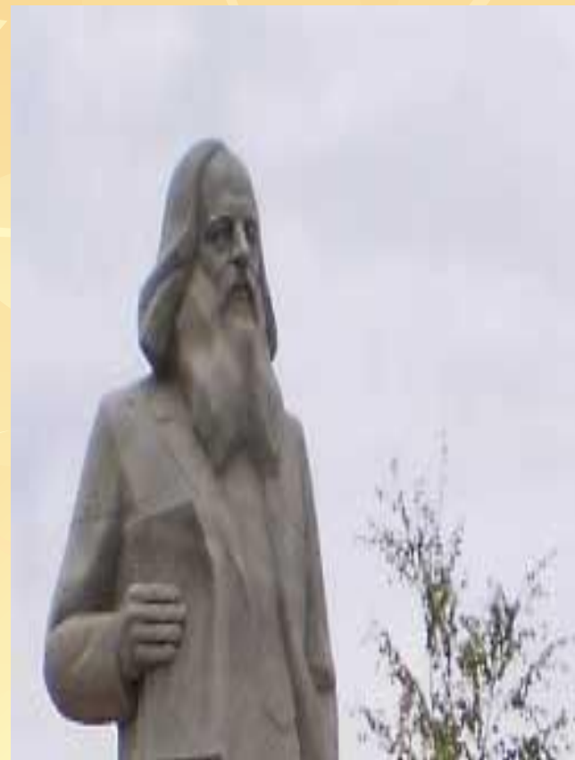
Памятник Д.И. Менделееву в Тобольске.

Российская Академия наук забаллотировала кандидатуру Менделеева в академики из-за его прогрессивных взглядов.