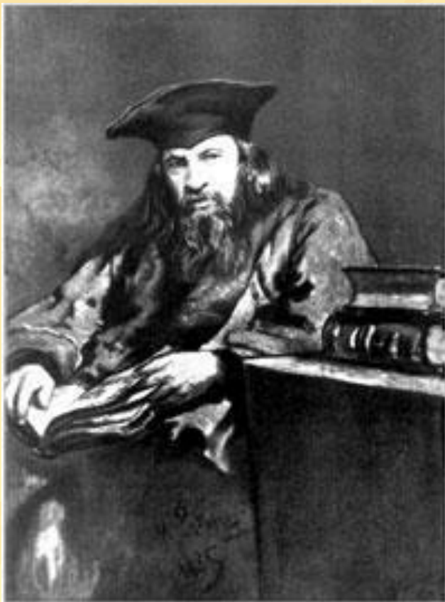
Д. И. Менделеев в мантии магистра наук.