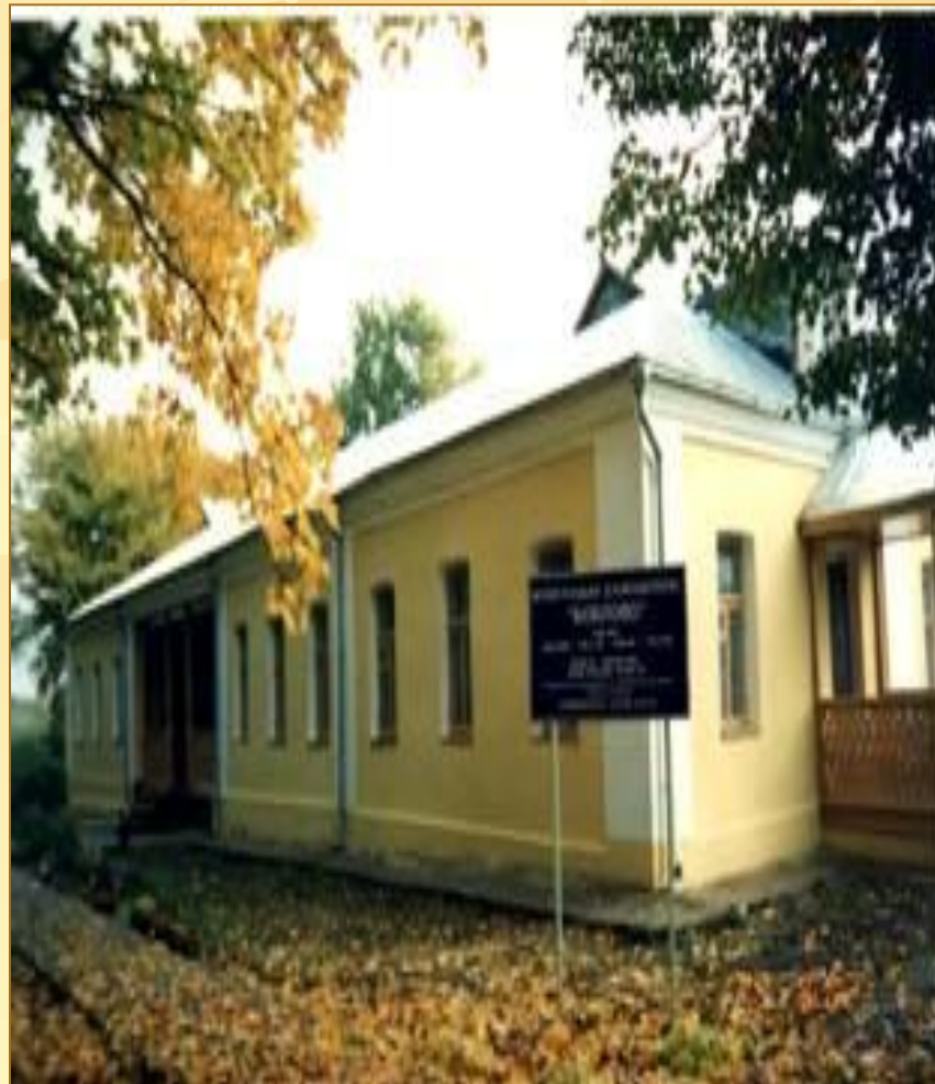
Музей – усадьба Боблово