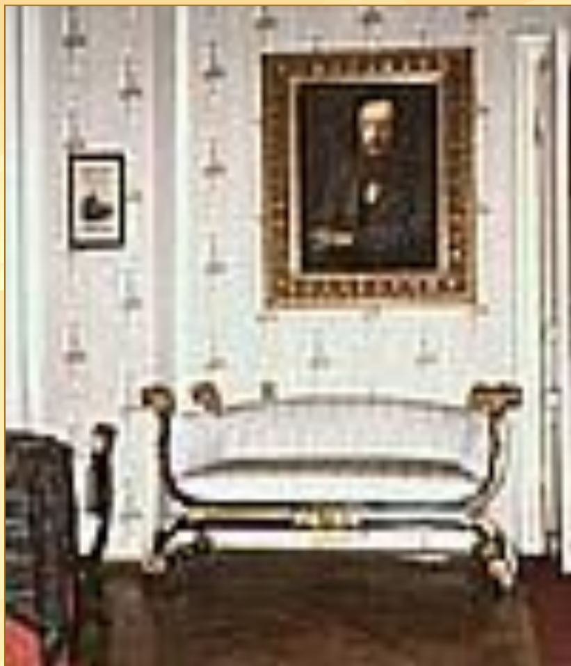
Музей – архив Д.И.Менделеева