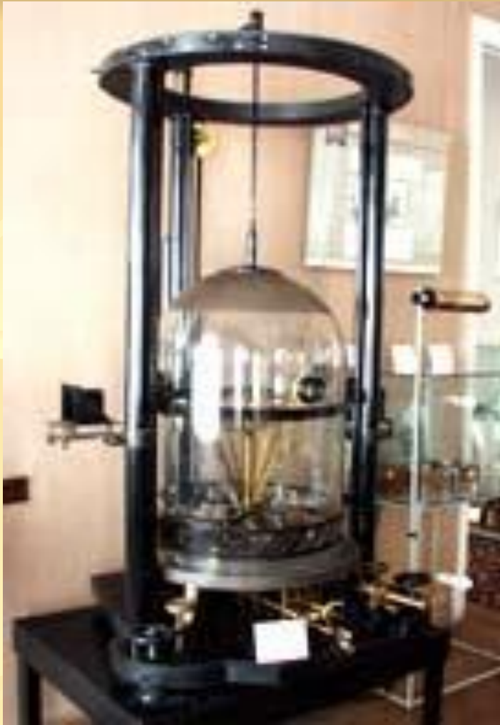
Метрологический музей Госстандарта России