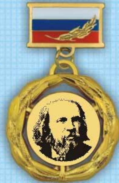
Юбилейная медаль К 175-летию со дня рождения Дмитрия Ивановича МЕНДЕЛЕЕВА

На всех родных самое сильное впечатление произвела несметная толпа народа, провожавшая ученого в последний путь. Молодежь несла в руках периодические таблицы. Это было лучшим венком и лучшим украшением на похоронах ученого, трудившегося всю жизнь для своей страны.