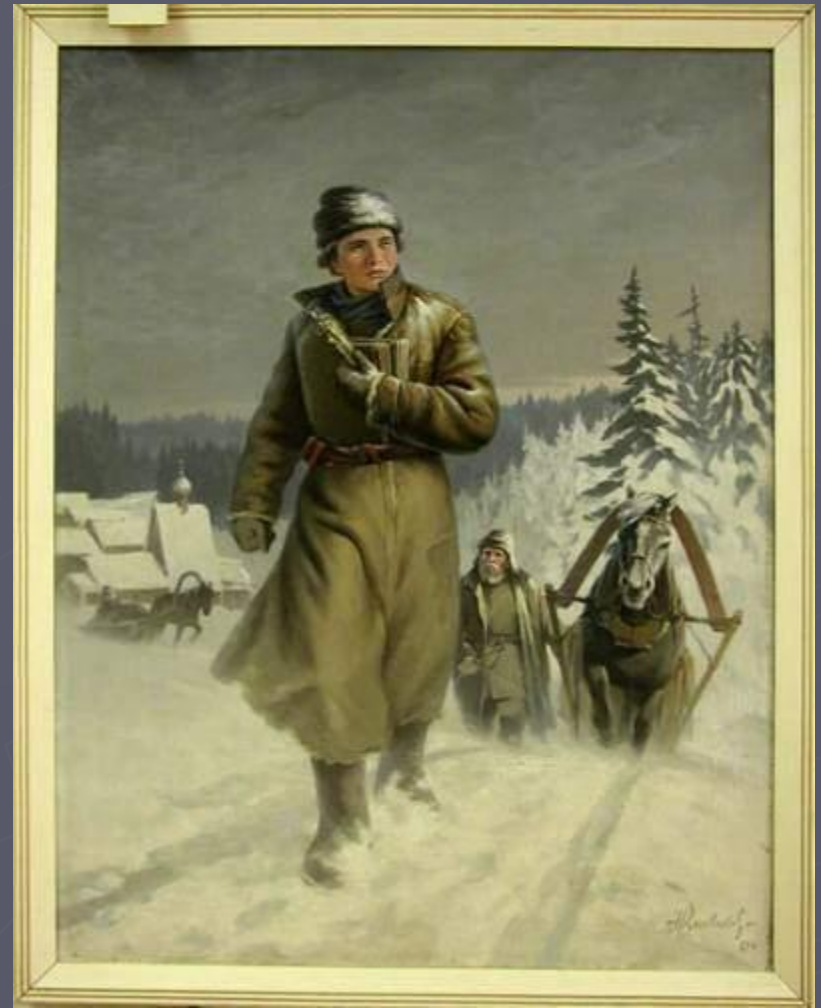
Н.И.Кисляков. Юный Ломоносов на пути в Москву