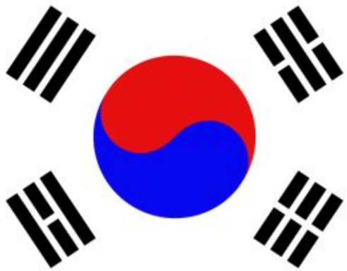
Флаг Республики Корея