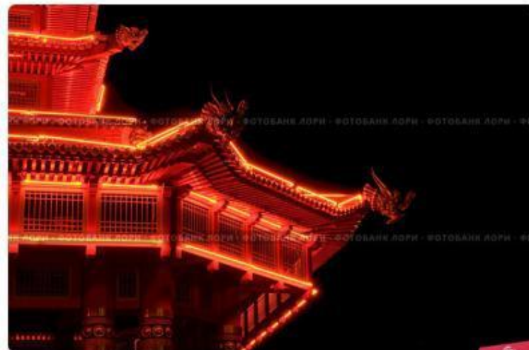
Элиста, Калмыкия. Фрагмент "Пагоды Семи Дней" с ночной подсветкой