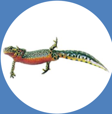
Видовжена, валькувата, з довгим хвостом