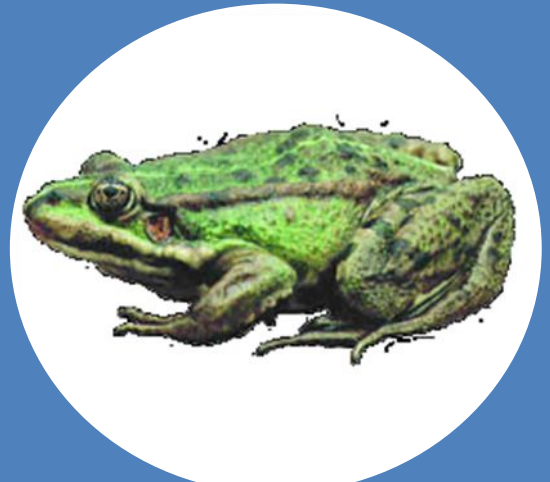
Приземкувата, сплющена зверху донизу, тіло вкорочене