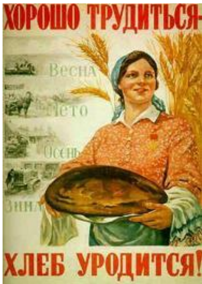
М.Соловьев. Плакат 1947 г.

Несмотря на эти трудности поставка зерна за границу продолжилась. Ежегодно увеличивались денежные и натуральные налоги. У колхозников отобрали приусадебные участки и отдали их колхозам. В 1948 г. Крестьянам рекомендовали продать государству мелкий скот и в ответ было зарезано 2 млн голов скота. Крестьяне не имели паспортов и не могли выехать в город. В результате снижения производства хлеба в н.50-х г. СССР начал закупать его за границей.