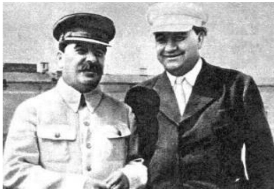
И.Сталин и Г.Димитров

С 1947 г. под давлением СССР ускорился процесс формирования коммунистических правительств в странах «народной демократии». В это же время установился коммунистический режим в С.Корее, а в 1949 г. в Китае. СССР оказывал им огромную материальную помощь, «привязывая» к себе. В 1949 г. был создан СЭВ, а в 1955 г. Организация Варшавского Договора. Кроме того коммунисты оказались у власти во Франции и в Италии.