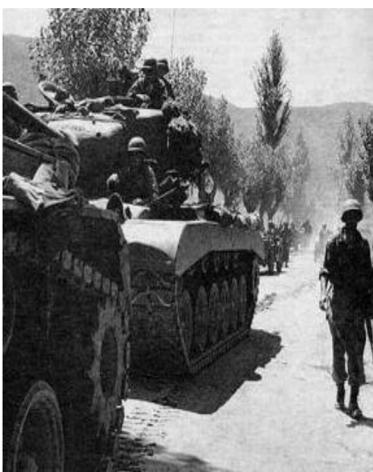
Американские войска в Южной Корее.

Высадившись в Чемульпо союзники стремительно освободили захваченные территории и вторглись в С.Корею. КНДР обратилась за помощью к Китаю и Советскому Союзу. Получив советскую технику и помощь Китайской армии, северяне выровняли линию фронта и в 1954 г. был подписан мирный договор. Корейская война показала, как «холодная» война легко может перерости в «горячую».