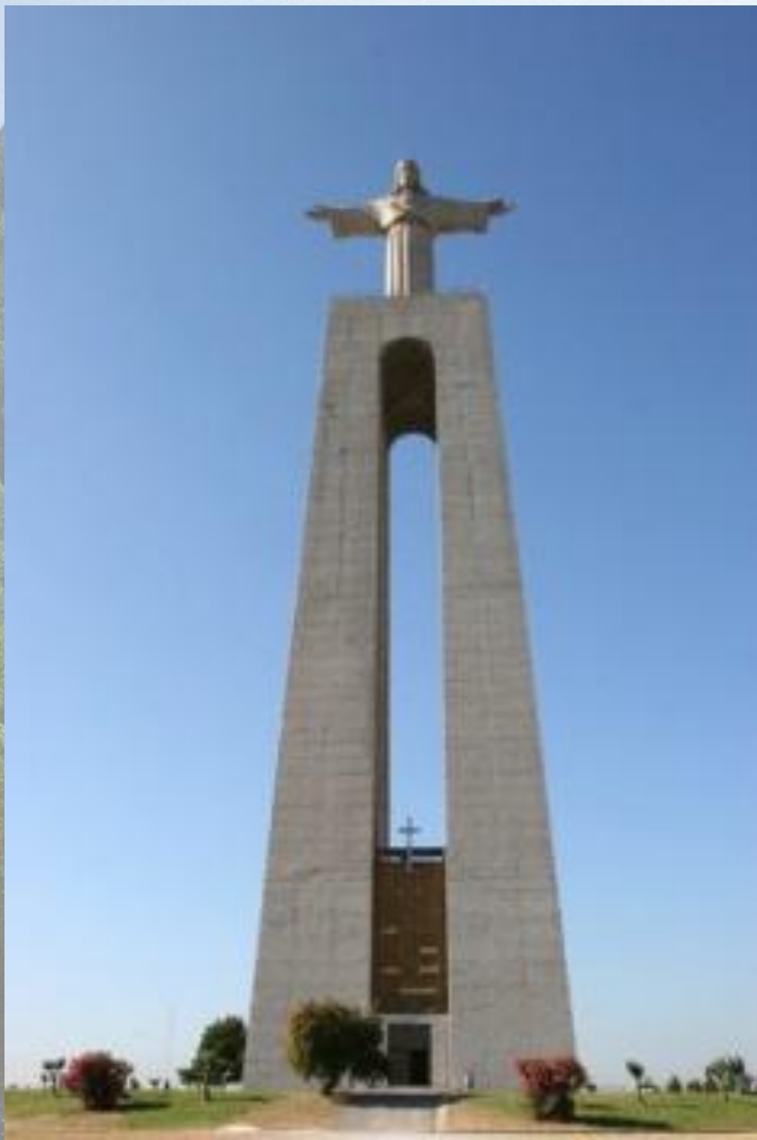
Статуя Христа возле Лиссабона