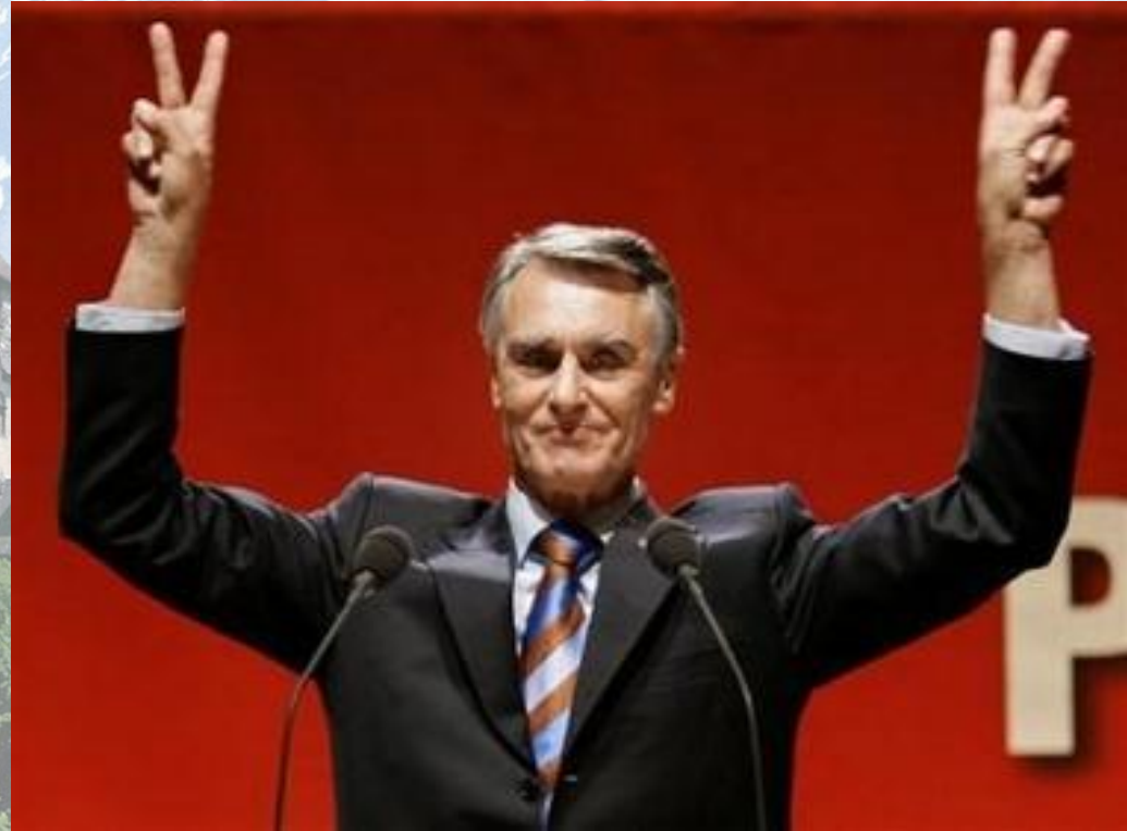
Президент Анібала Каваку