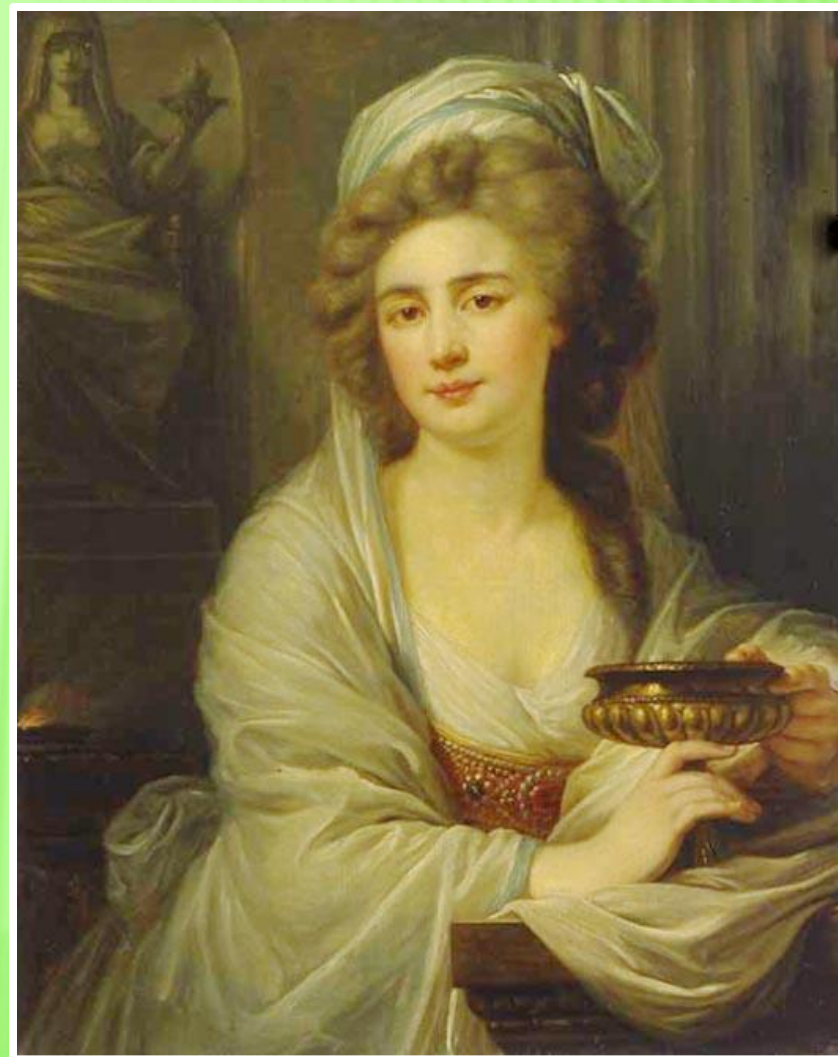
Софія де Вітт- Потоцька

Жіноча краса теж, але вона нетривка, і хто згадає красуню через століття? Портрети... А що – портрети? Їх знають лише спеціалісти і музейні працівники. Тож мало хто залишається в пам'яті прийдешніх поколінь Красунею з великої літери. Софії де Вітт-Потоцькій поталанило. Її вроду береже один з найгарніших парків України і світу – “ Софіївка ”.