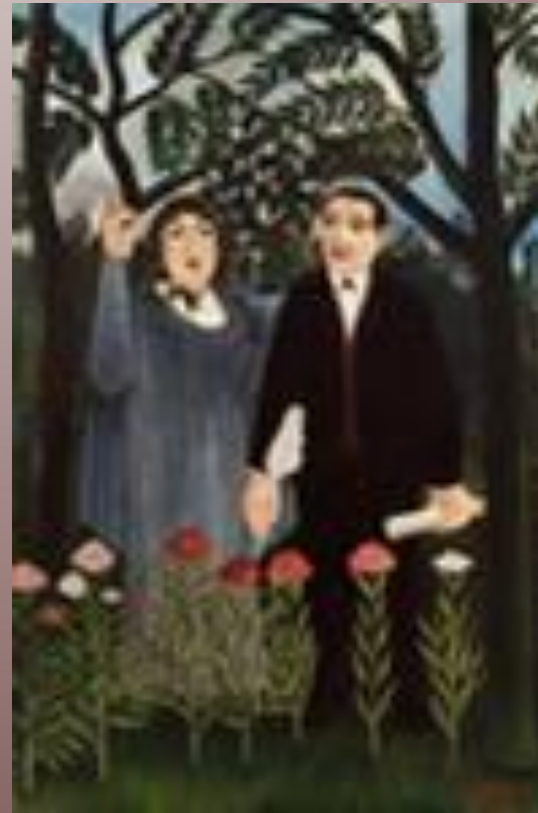
Художник Анрі Руссо. Гійом Аполлінер і його муза.

У Парижі письменнику жилося важко, він перебивався випадковими заробітками, нарешті влаштувався вчителем у заможну родину і виїхав з нею за кордон. Нові враження сприяли виявленню художнього таланту Г. Аполлінера – цим псевдонімом з 1902 р. він став підписувати свої поезії.