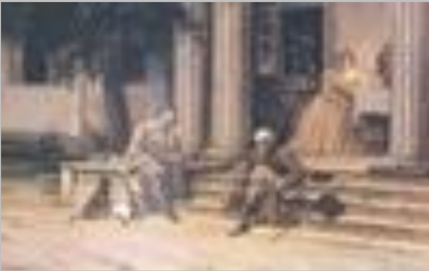
М.В. Гоголь у Яновщині