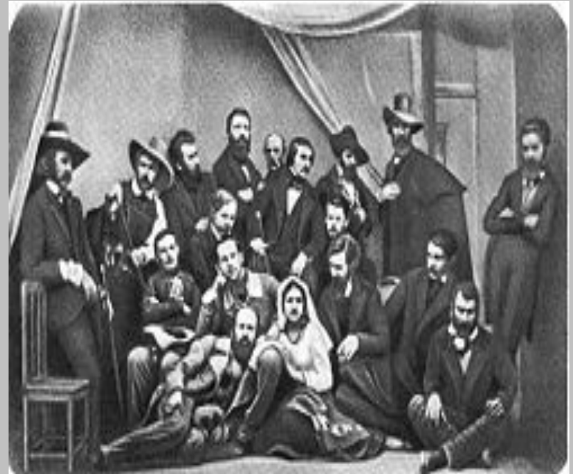
М.В. Гоголь з російськими художниками в Римі. 1845 р.