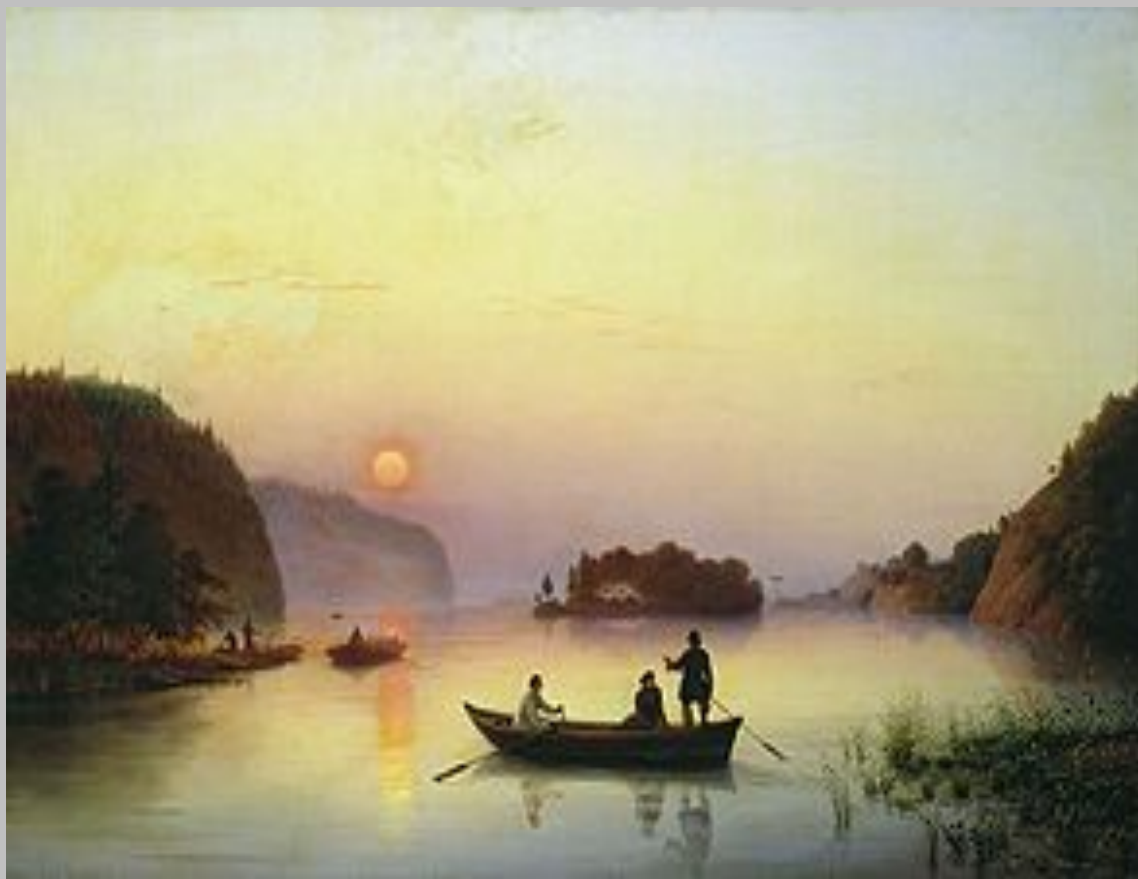
Переправа Гоголя через Дніпро