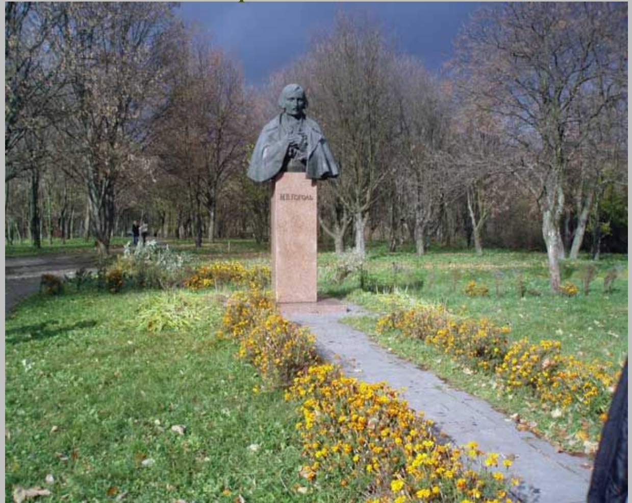
Бюст М.В.Гоголя Автори О.Ковальов і В.Шевченко

У селі Гоголево на Полтавщині, на батьківщині М.В.Гоголя, з нагоди 175-річчя з дня народження письменника, 1 квітня 1984 року, відкрили заповідник- музей.