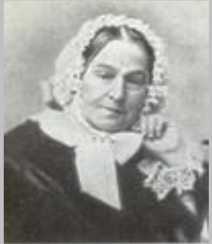
Марія Іванівна Гоголь. Фотографія.