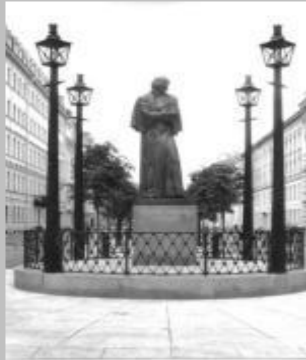
Мала Конюшенна вулиця

Скульптор М.В.Белов, архітектор В.С.Васильковський.