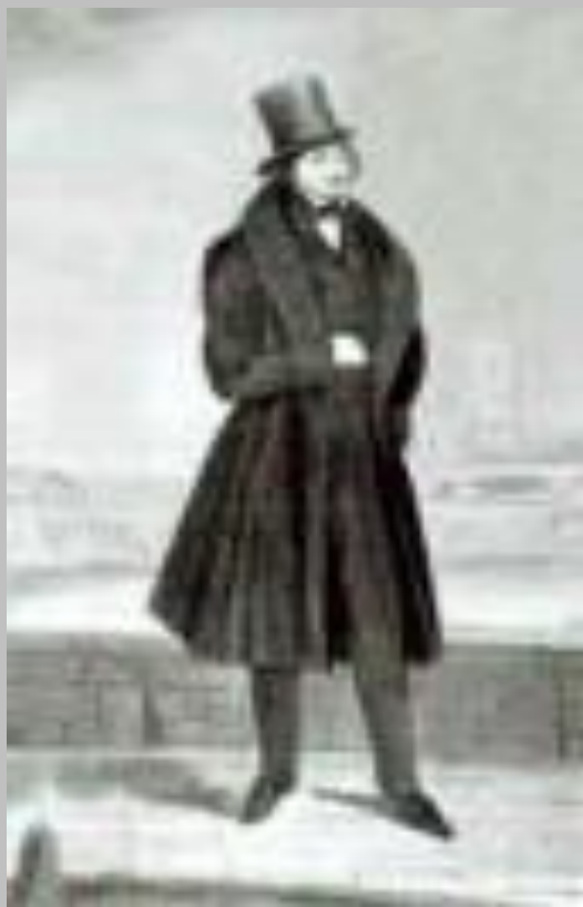
Портрет работи Горюнова.

«Все свои ныне печатные грехи я писал в Петербурге, и именно тогда, когда я был занят должностью, когда мне было некогда, среди этой живости и перемены занятий, и чем я веселее провел канун, тем вдохновеннее возвращался домой, тем свежее у меня было утро».