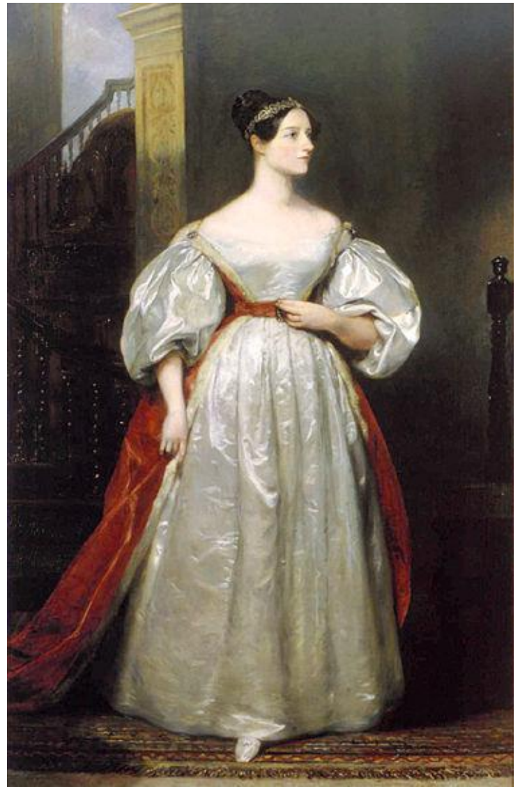
Математик Пекла Лавлейс, дочка поета

Старший внук лорда Байрона, Ноел, народився 12 травня 1836 р., недовго служив в англійському флоті, і після буйного і безладного життя помер 1 жовтня 1862 р. працівником в одному з лондонських доків. Другий внук, Ральф Гордон Ноел Мілбенк, народився 2 липня 1839 р., вступив після смерті брата, що успадкував незадовго до кончини баронство Уїнтворт від бабусі, в права лорда Уїнтворта (Wentworth).