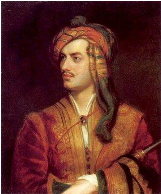
Байрон в албанському костюмі

У червні цього ж року Байрон відправився подорожувати. Можна було вважати, що молодий поет, отримавши таку блискучу перемогу над своїми літературними ворогами, поїхав за межу задоволений і щасливий, але це було не так. Байрон виїхав в страшно пригніченому стані духу, і, побувавши в Іспанії, Албанії, Греції, Туреччині і Малій Азії, повернувся в ще більш пригнобленому стані. Особи, що ототожнювали його з Чайльд-гарольдом, висловлювали припущення, що за кордоном, подібно до свого героя, він вів дуже непомірне життя, але Байрон і друкарський і усно протестував проти цього, кажучи, що Чайльд-Гарольд — плід уяви. Томас Мур говорив в захист Байрона, що він був дуже бідний, щоб тримати гарем, а, крім того живив в цей час романну пристрасть до невідомої дівчини, що їздила з ним, переодягнута хлопчиком. Байрона, очевидно, турбували його фінансові невдачі. В цей же час він позбувся матери, і хоча жив з нею далеко не в ладах, але проте дуже шкодував про неї.