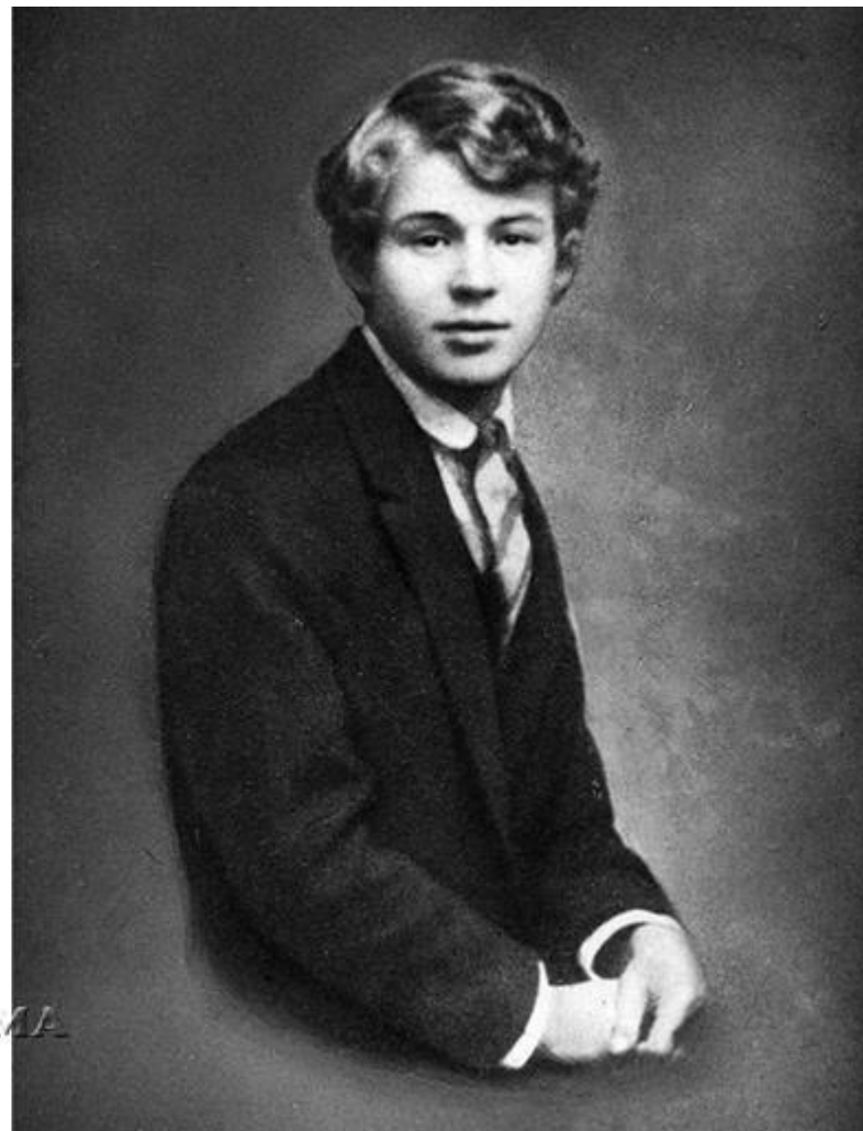
С.А. Есенин 1913г.