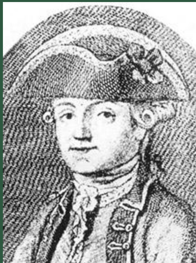
Капітан Джон Байрон, батько Джорджа Гордона Байрона.