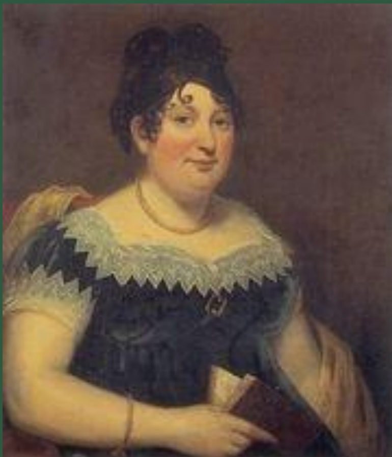
Місіс Байрон, мати Джорджа Гордона Байрона.