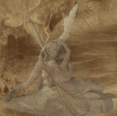
Психея, разбуженная поцелуем Амура. 1739 г.