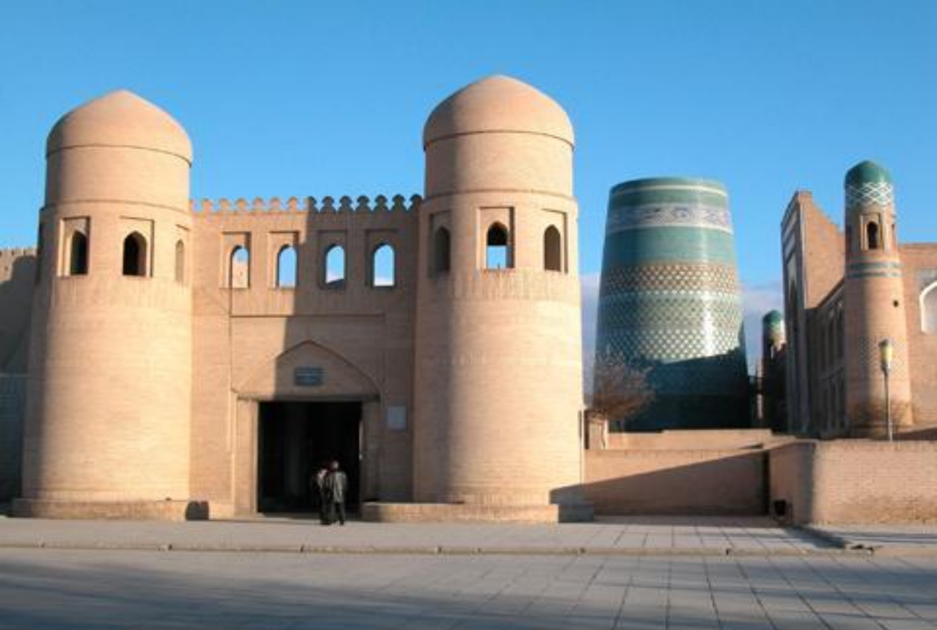
The entrance gates - Ata Darvaza