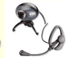
веб - камера