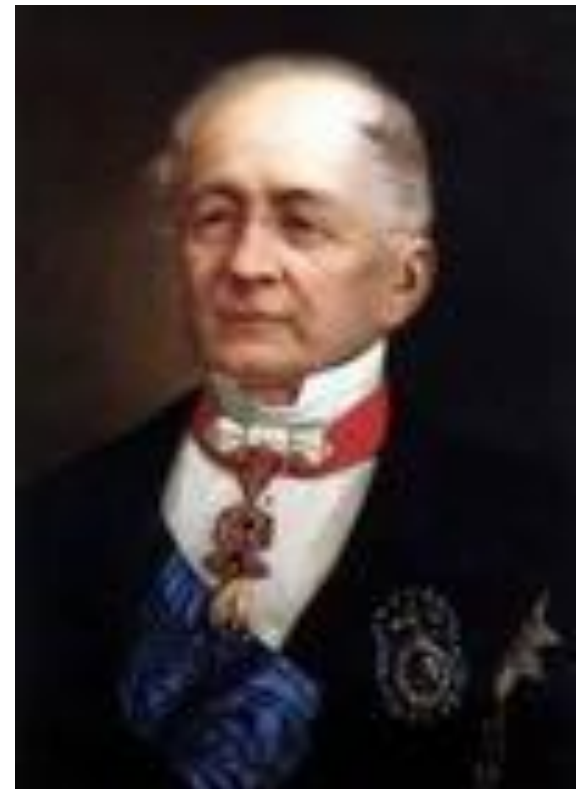
А. М. Горчаков

1) Используя противоречия между государствами, на международной конференции в Лондоне в 1871г. Россия получила разрешение строить крепости на Черном море и иметь там флот ( 1856г. -министр иностранных дел А. М. Горчаков, лицейский друг Пушкина, один из блестящих русских дипломатов, внешняя политика-"собрание сил").