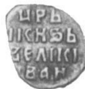
Копейные деньги 1534 года