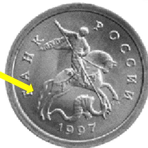
Аверс или «орёл»