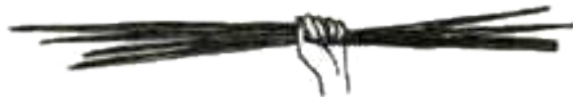
Железные прутья из Греции. По-гречески «горсть» - драхма.