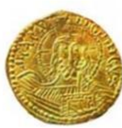
Серебряники и златники