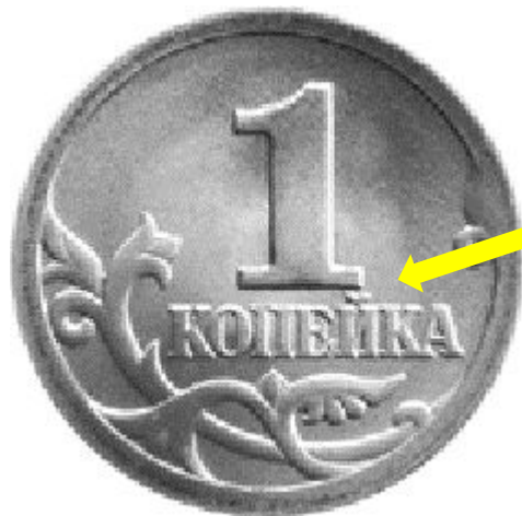
Реверс или «решка»