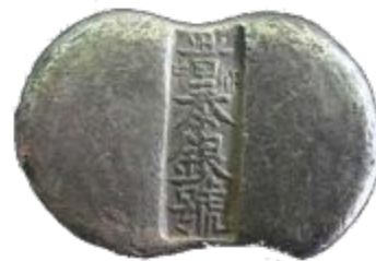
Серебряный лям из Китая