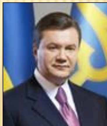
Виктор Федорович Янукович