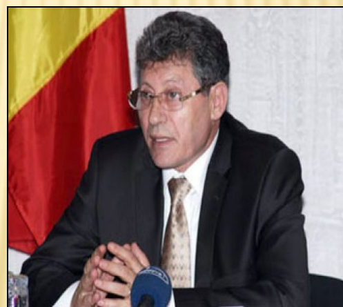
И.о. президента Михай Гимпу