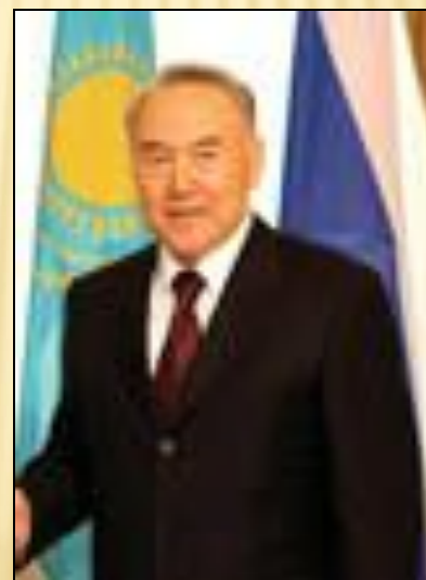
Нурсултан Абишевич Назарбаев