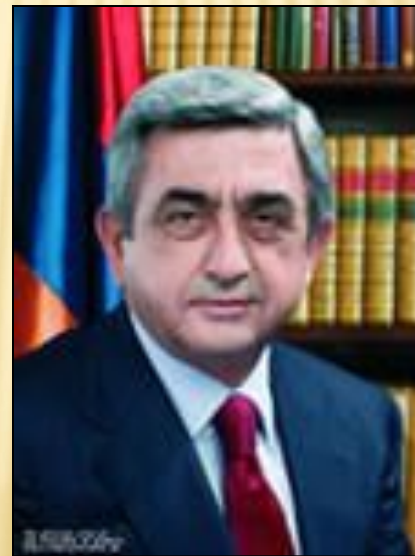
Серж Азатович Саргсян