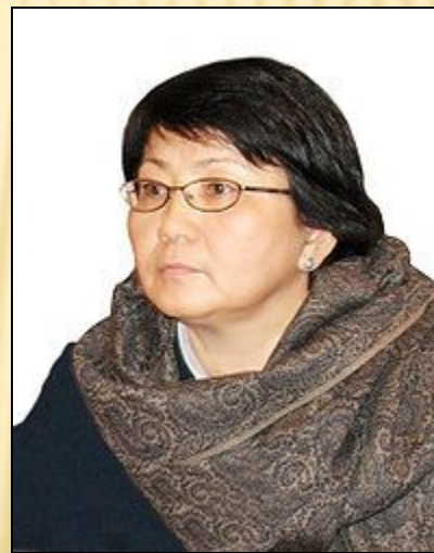
Роза Исаковна Отунбаева