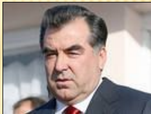
Эмомали Шарипович Рахмонов