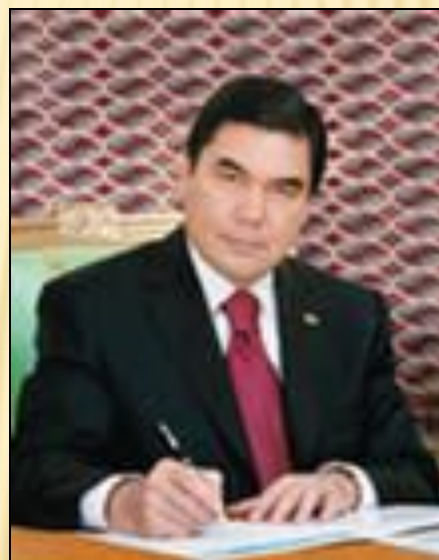
Гурбангулы Мяликгулыевич Бердымухамедов