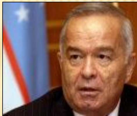
Ислам Абдуганиевич Каримов