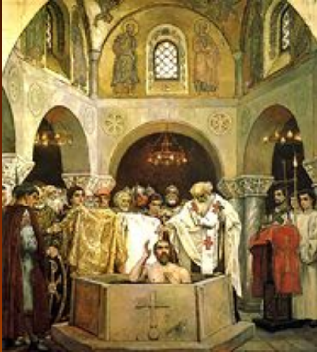
Фреска В.М. Васнецова. Крещение Владимира.