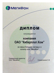
Диплом «Мегафон» за самый большой вклад в «копилку», 2005 г.