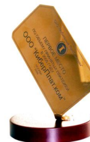
Диплом МТС: первое место по объему принятых платежей, 2006 г.