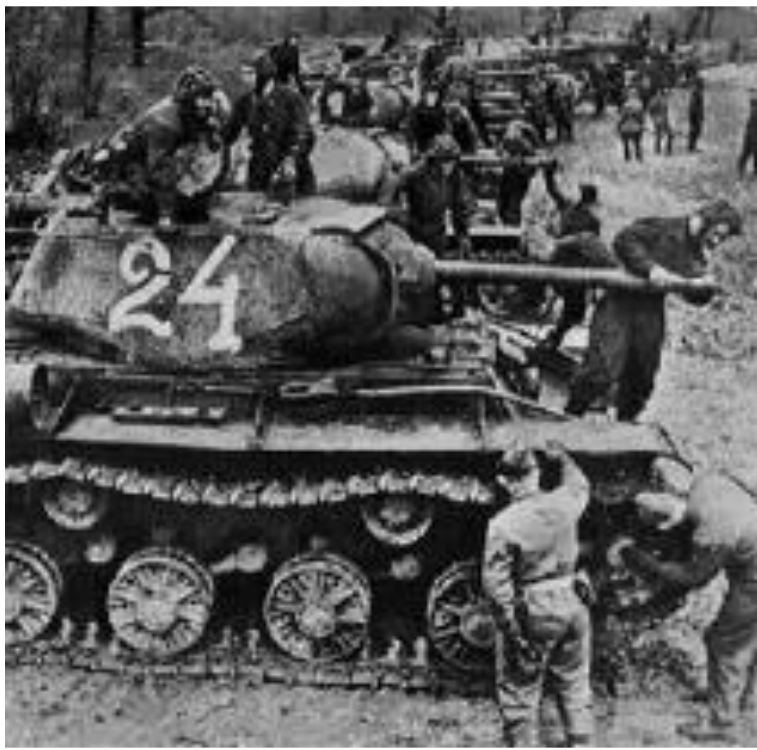
Советские танки Перед Курской битвой

12 июля советские войска перешли в наступление Под д.Прохоровка разгорелось крупнейшее в истории танковое сражение(1200 машин). Этот день стал переломным в ходе битвы.В течение месяца были освобождены Харьков, Орел,Белгород. германия потеряла 500000 солдат,1500 танков, 3700 самолетов. В сентябре 1943 г. началась битва за Днепр, и 6 ноября Красная Армия освободила Киев.