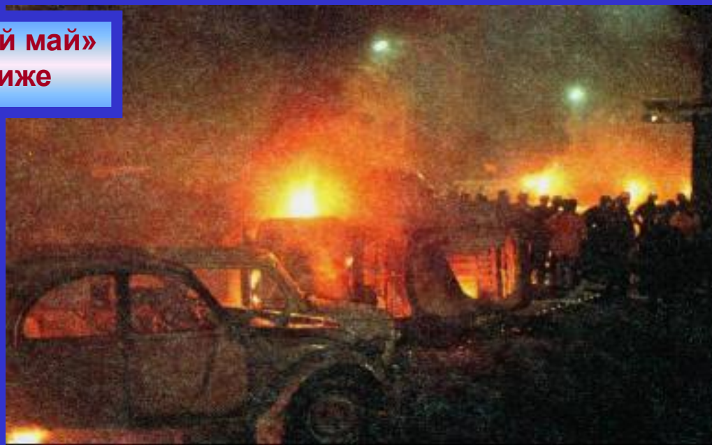
«Красный май» в Париже

Мощные выступления студентов прошли по всей Франции. Безработица среди молодёжи, авторитарные порядки в студенческих городках привели к социальному взрыву. В начале мая 1968 г. была разогнана студенческая демонстрация. В ответ студенты заняли Латинский квартал Парижа. Их лидер, Кон-Бендит призвал к решительной борьбе с капиталистической системой.