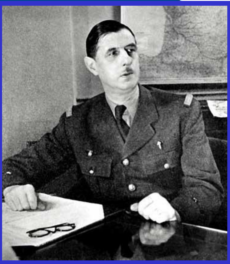
Шарль де Голль

После окончания Второй мировой войны Франция утратила положение вели-