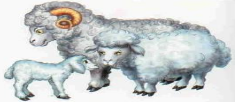
Овца — баран — ягнёнок