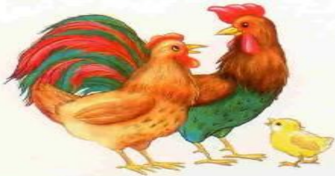
Курица — петух — цыплёнок