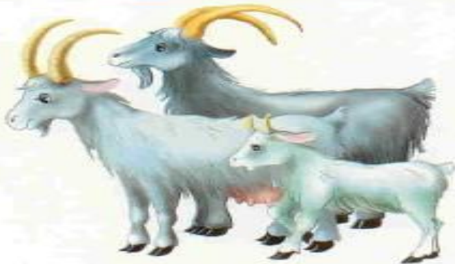
Коза — козёл — козлёнок