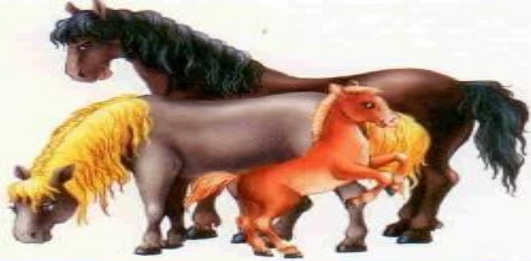
Лошадь — конь — жеребёнок