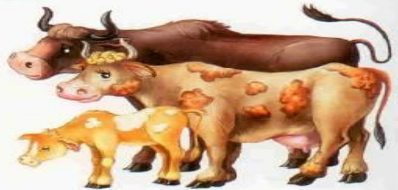
Корова — бык — телёнок