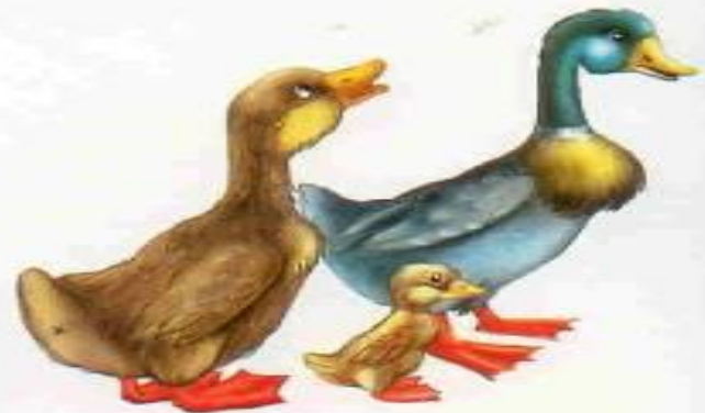
Утка — селезень — утёнок