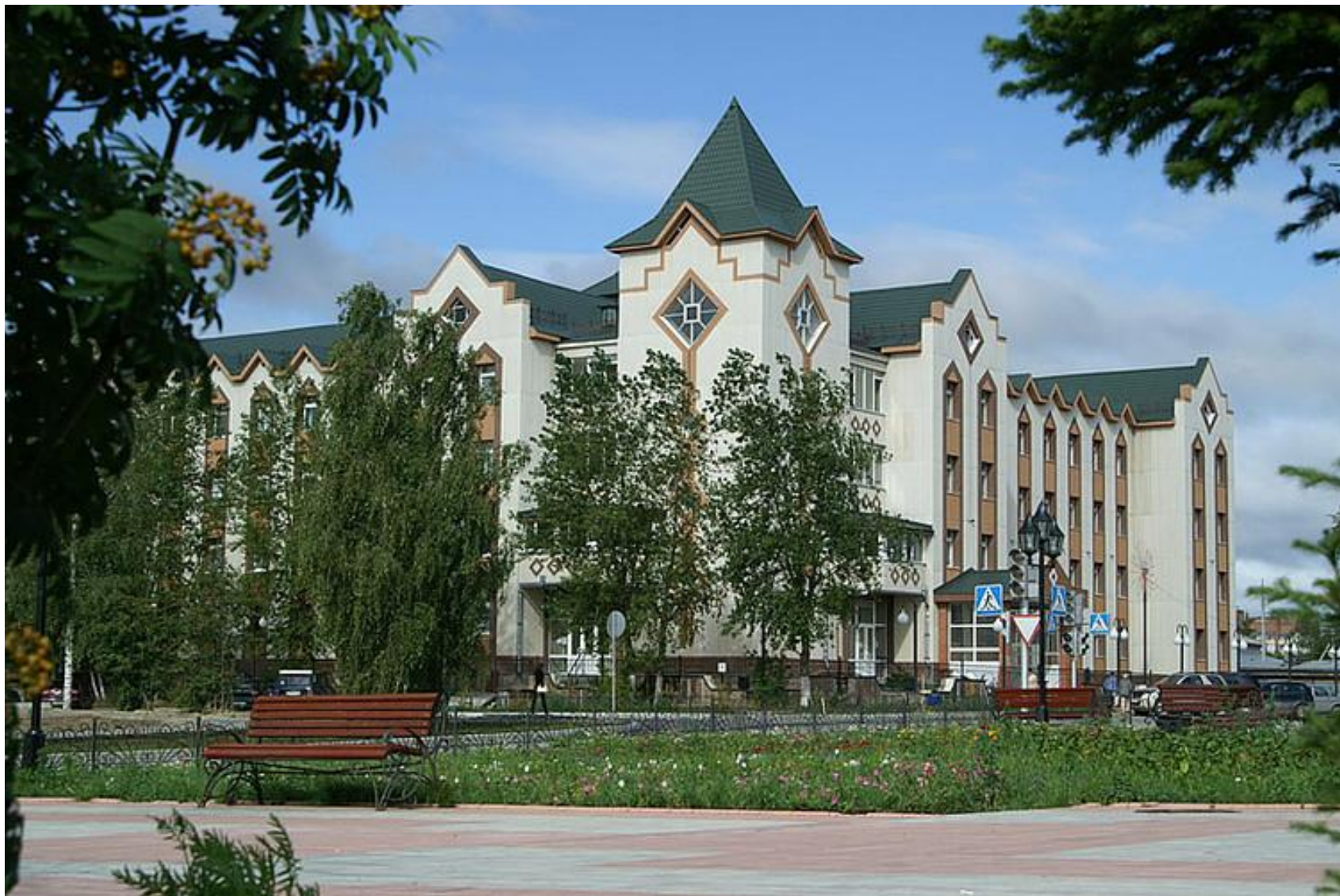
Центральная городская больница