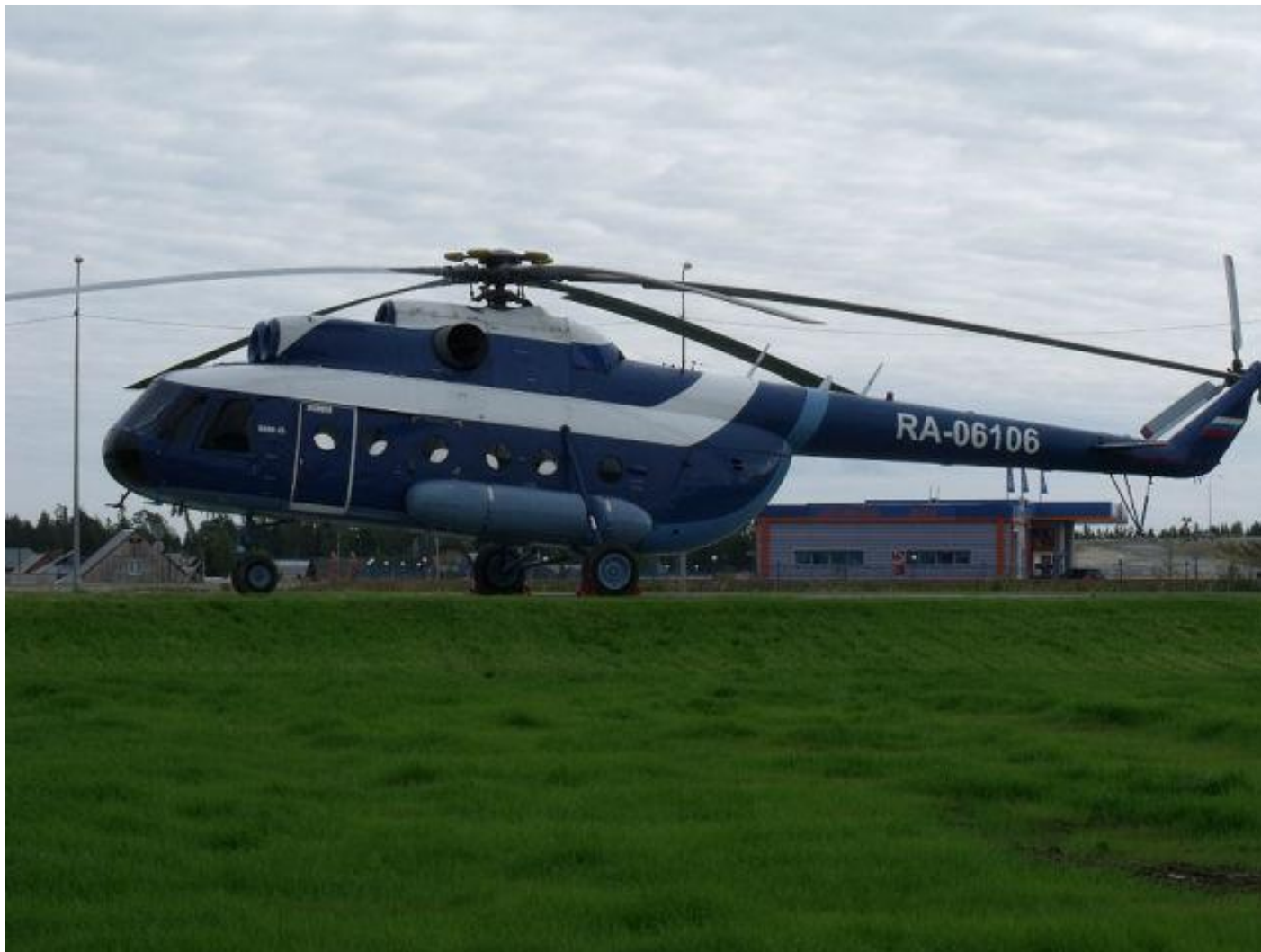
Мемориал первооткрывателей северных трасс Вертолёт МИ-8