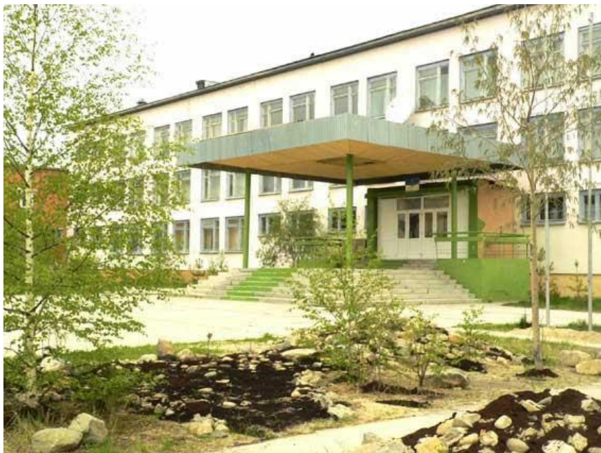
МБОУ «СОШ № 5»

В городе находится 6 средних общеобразовательных школ, школа искусств, детская художественная школа, политехнический центр