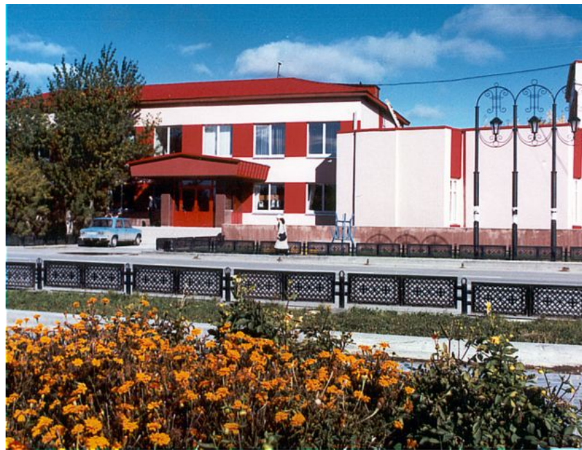
"Детская школа искусств"