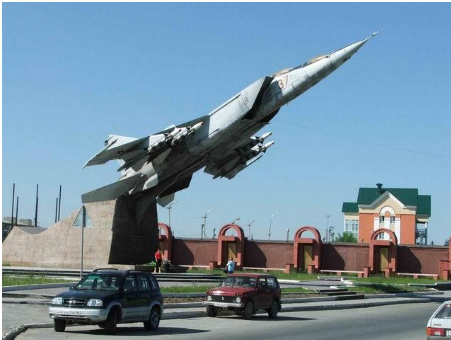
Памятник-мемориал «Защитникам и первопроходцам земли Югорской»