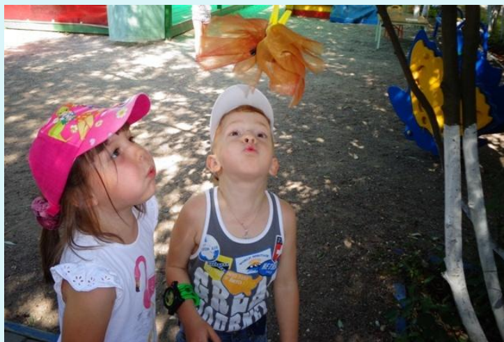
«Чья бабочка выше улетит»