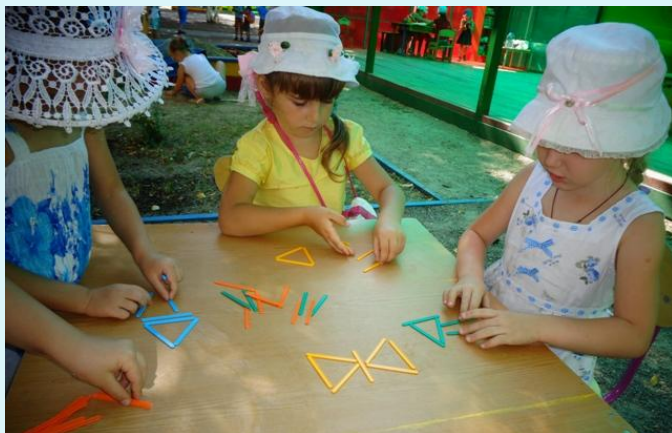
«Кто быстрее соберет бабочку»