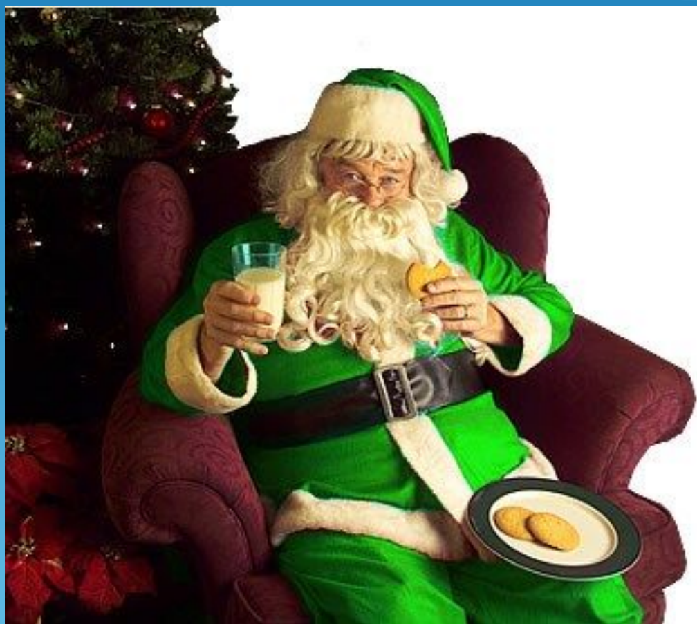
Father Christmas in a green coat

Ни для кого не секрет, что Англия и Америка празднуют и чествуют Рождество куда больше, чем Новый год. Маленькие британцы ожидают подарки не от Санты, а от Отца Рождества (Father Christmas). Именно так изначально называли доброго бородатого волшебника в зеленом облачении, разносящего гостинцы.