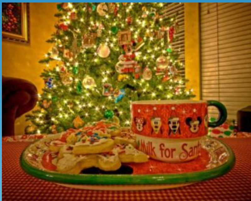
Milk and biscuits