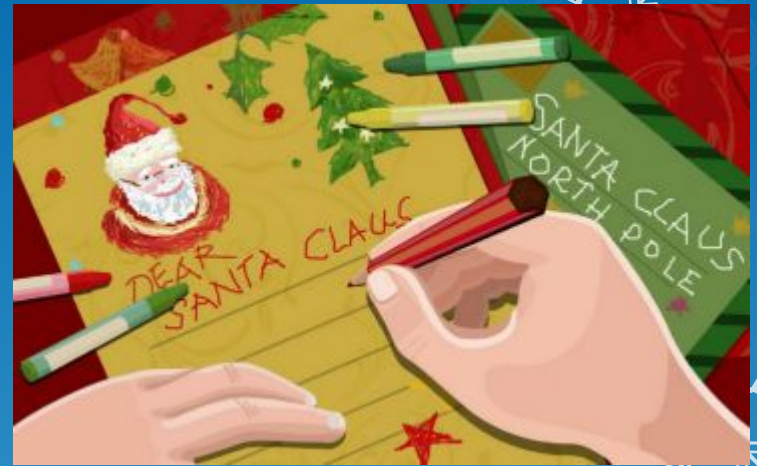
A letter to Santa

Детвора подбрасывает письма с пожеланиями в камин и ожидает золотые монетки и подарки в специальных рождественских носках и чулках.