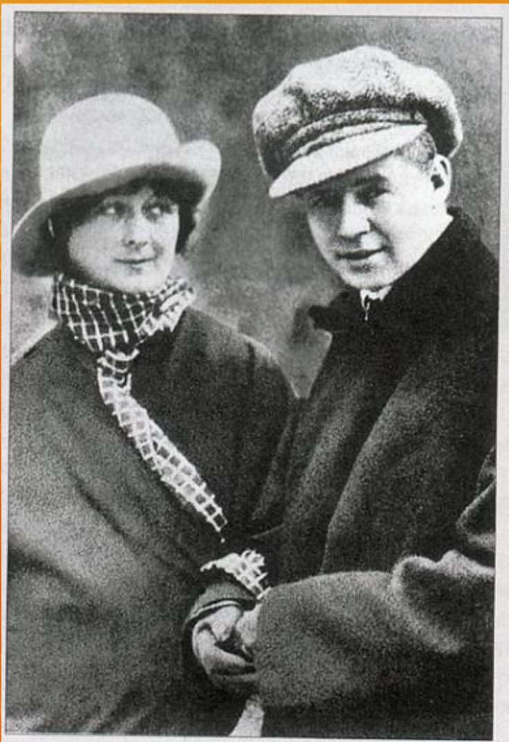
Есенин и Айседора Дункан, 1922