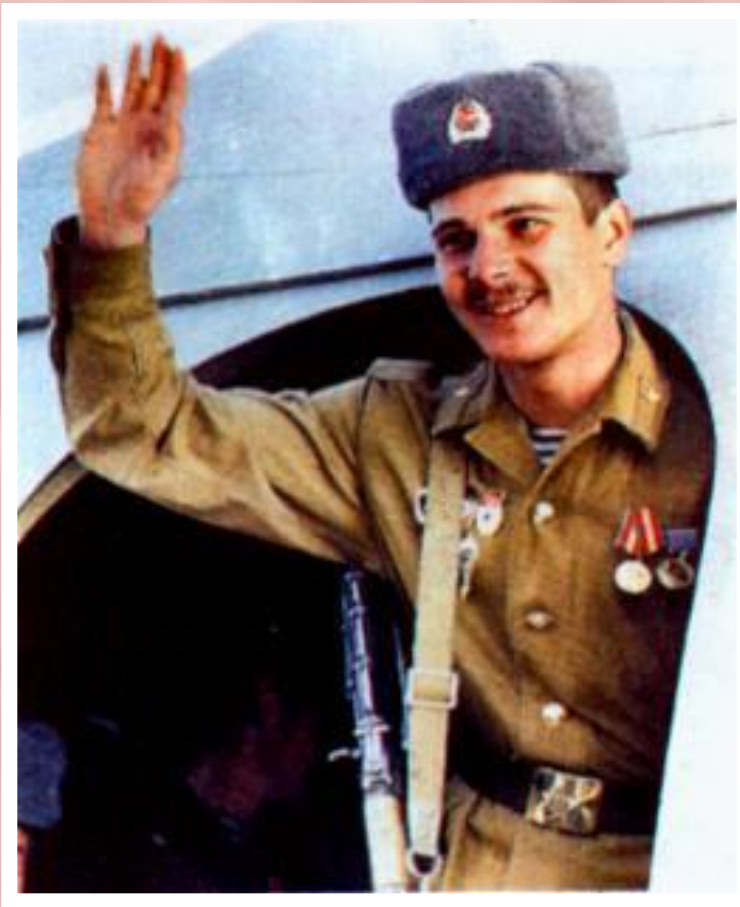
Советский солдат перед отлетом из Кабула.

Самой острой региональной проблемой для СССР была продолжающаяся война в Афганистане. В 1988 г. было заключено соглашение о прекращении американской помощи моджахедам и выводе из страны советских войск. 15 февраля 1989 г. последние советские части покинули Афганистан. Наши потери составили 14,5 тыс. человек убитыми, 54 тыс. - ранеными. Прекратилось советское военное присутствие в Эфиопии, Мозамбике, Никарагуа.