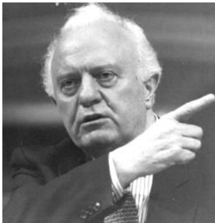
Министр иностранных дел СССР Э.А.Шеварнадзе.

Эти идеи были сформулированы в книге М.С.Горбачева «Перестройка и новое мышление для нашей страны и для всего мира».