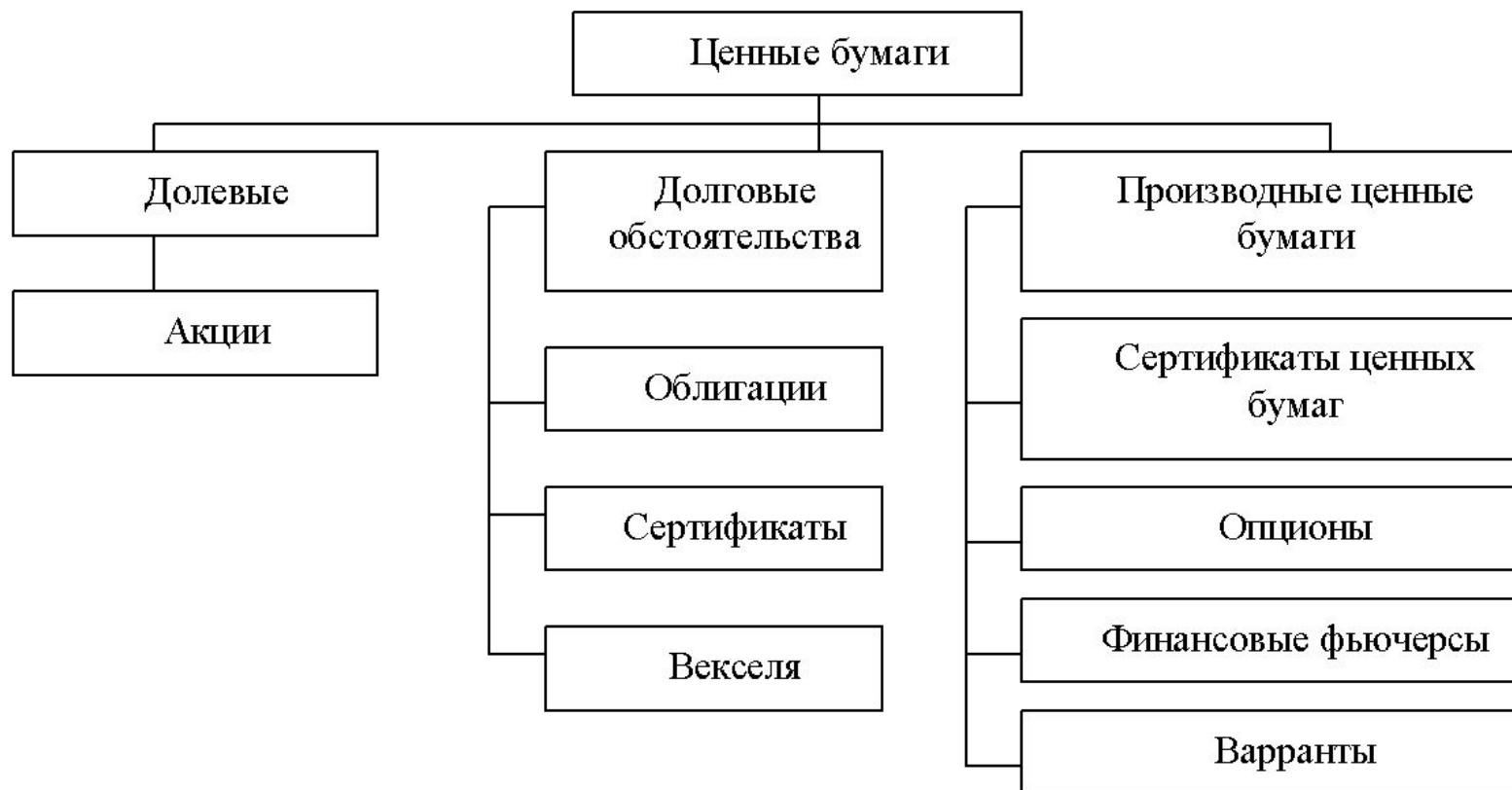
Рис. 1.1 Классификация ценных бумаг