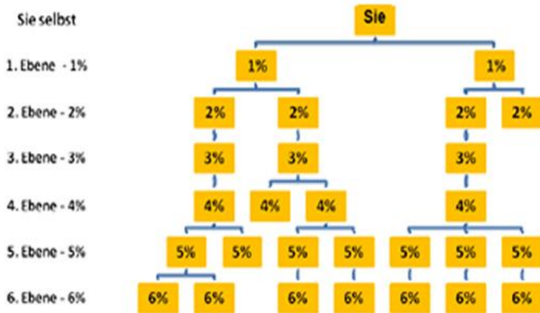
Schaubild: Aufbau eines eigenen Teams

7. Ebene und tiefer: Bis 1% Tiefenbonus auf den Gesamtumsatz Ihrer kompletten Downline (offene Linien) ab der 7. Ebene .