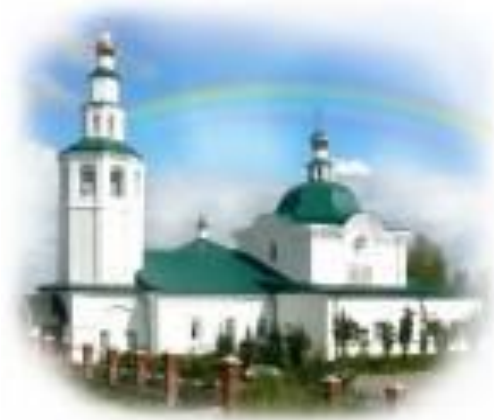
Рис.3. Зырянская крепость (Березники)