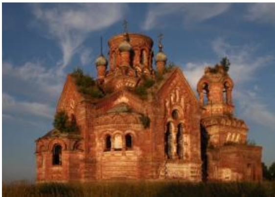
Рис.1. Петропавловская церковь (Усолье)