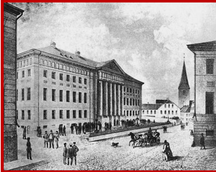
Университет, открытый в 1799г. Павлом I в г. Дерпт