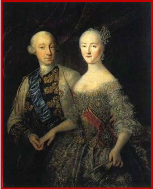
Родители Павла I – Петр III и Екатерина II