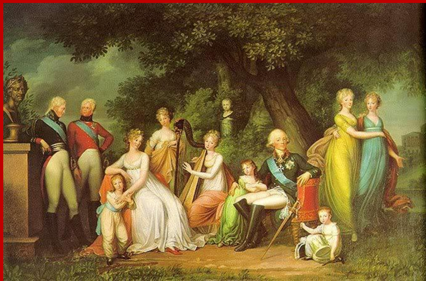
Герхардт фон Кюгельген. Портрет Павла I с семьей. 1800