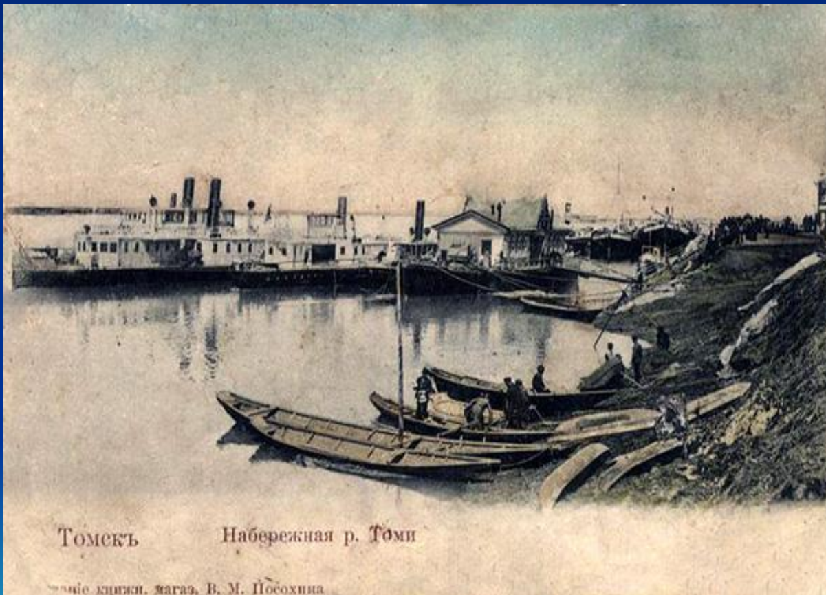
Томскъ Набережная р. Томи