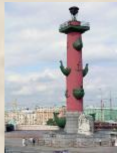
Скульптуры Ростральных колонн