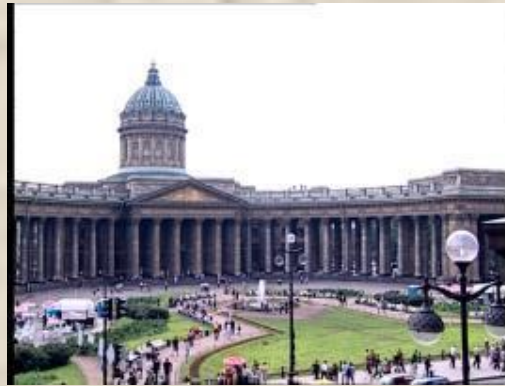
Казанский собор (Воронихин)