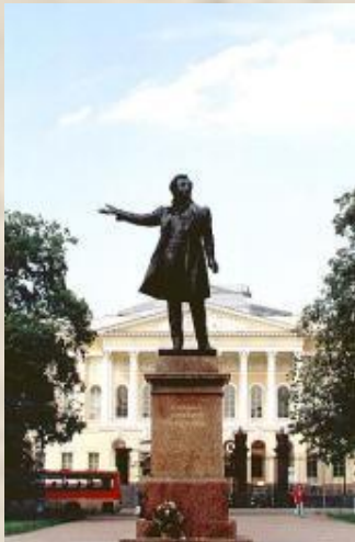
Постамент памятника Пушкину