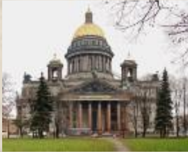
Колонны Исаакиевского собора. Арх. Монферран. Масса колонн – 114 т. Высота собора – 101 м