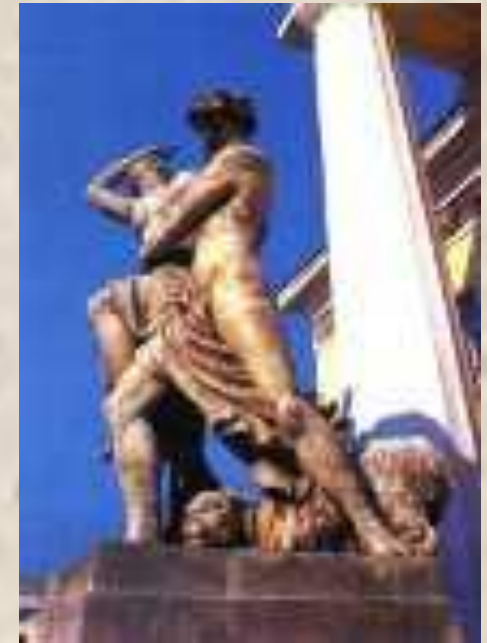
Скульптуры у Горного института