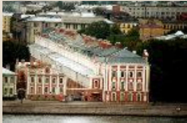
Здание 12 коллегий