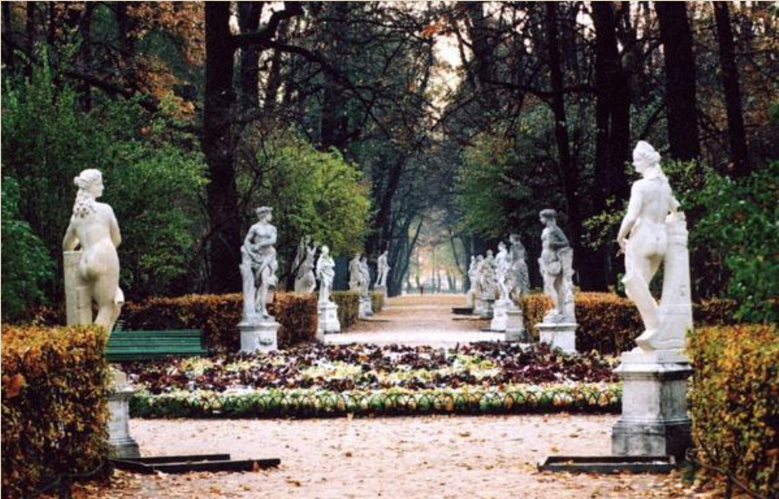
Скульптуры Летнего сада

Белый, равнозернистый, полупрозрачный. Италия