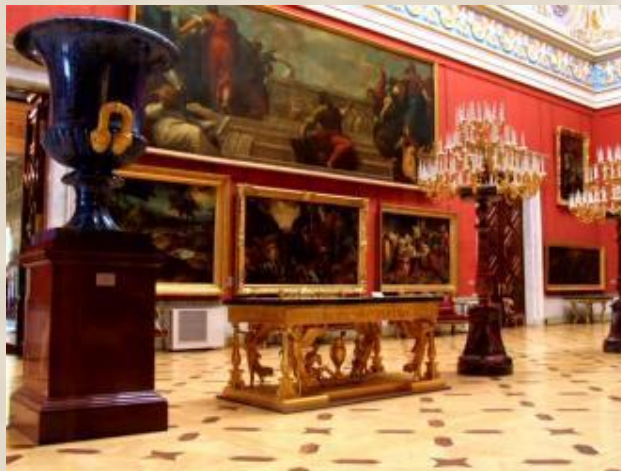
Чаша из лазурита.