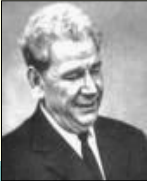
П. К. Анохин

Всю деятельность системы и ее всевозможные изменения можно представить целиком в терминах результата :