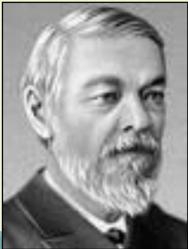
И. М. Сеченов

«Жизненные потребности рождают хотения, и уже эти ведут за собой действия : хотение будет мотивом или целью, а движение – действием или средством достижения цели. Без хотения как мотива или импульса движение было бы вообще бессмысленно...»