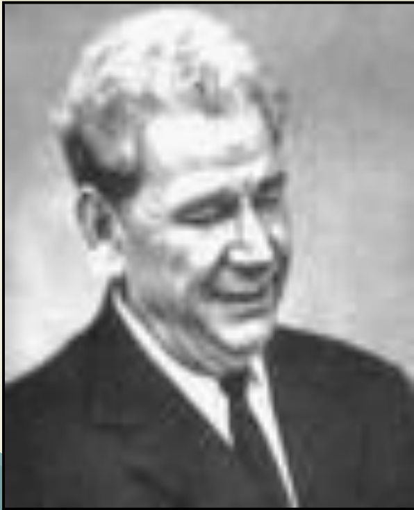
П. К. Анохин