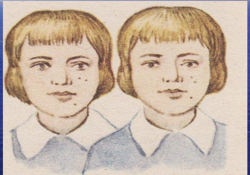
Рис. 44. Сходство в расположении родинок у идентичных близнецов