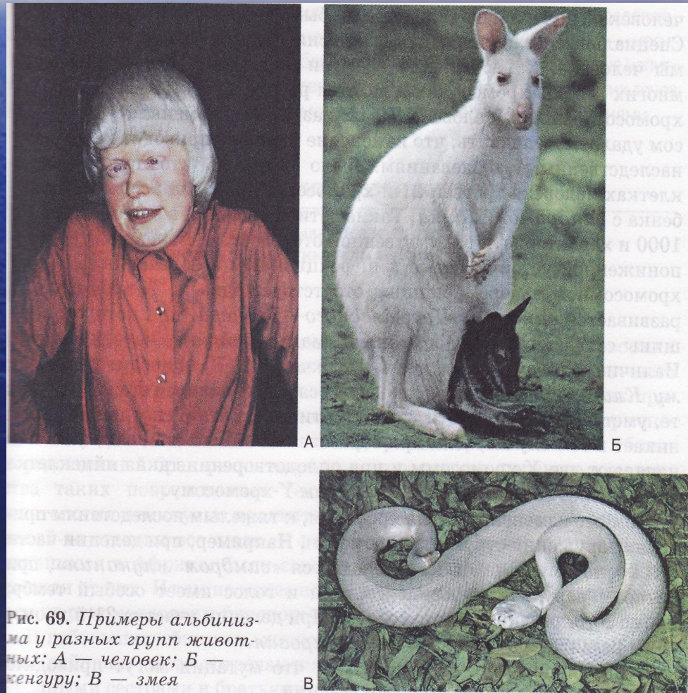
Рис. 69. Примеры альбинизма у разных групп животных: А — человек; Б — кенгуру; В — змея

Если к болезни приводит возникающий в результате мутации рецессивный ген аутосомы, говорят об аутосомно-рецессивном наследовании заболевания. Так наследуется альбинизм – врожденное отсутствие пигментации кожи, волос и радужки глаза. Такое отклонение возникает только у рецессивных гомозигот ( aa ) по данному признаку. В случае рождения гетерозиготной особи ( Aa ) действие рецессивного гена не проявляется.