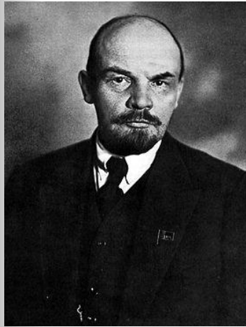
В.И. Ленин (1824-1870гг)

российский и советский политический и государственный деятель. Написал работу "Империализм как высшая стадия капитализма" в ней даны основные определения и характеристики системы мирового капитализма.