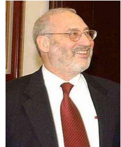
Джозеф Юджин Стиглиц 1943г.

Американский финансист, инвестор и филантроп. Написал работу «Тезисы о глобализации», где указал о проблеме мирового капитала и налогообложения.