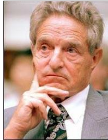
ДЖОРДЖ СОРОС 1930г.

российский и советский политический и государственный деятель. Написал работу "Империализм как высшая стадия капитализма" в ней даны основные определения и характеристики системы мирового капитализма.